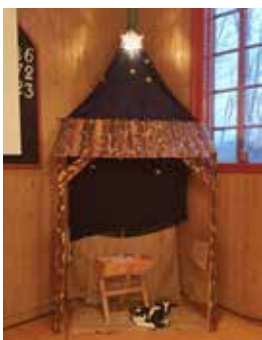
Stall – Saltstraumen kirke.

Men den som jeg velger å ta med denne gangen er vår egen salme, Mitt hjerte alltid vanker. Hans Brorson, 1694 – 1764, er en av våre store danske salmediktere. Denne flotte julesalmen er et av hans store dikt, og tar oss med inn i undringen over julens budskap, Jesus ble født i en stall, i meget