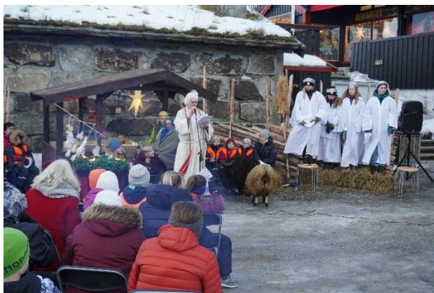
Skulegudsteneste ved Stallen, Sentralplassen