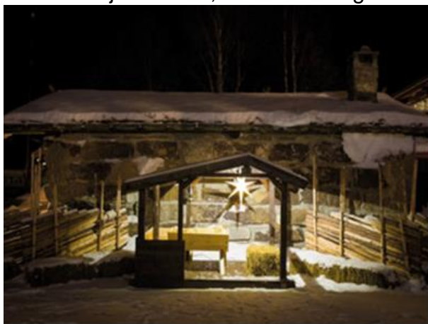
Stallen på Sentralplassen - eit nytt heilag rom