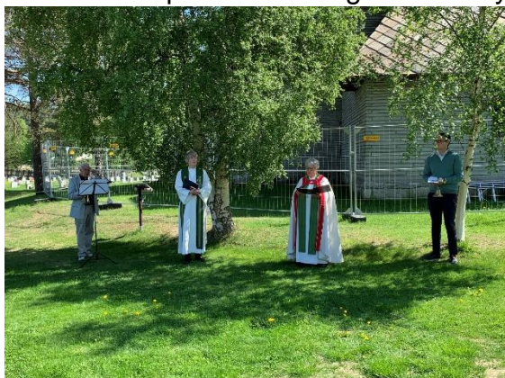
vandringsgudsteneste 14. juni

33 gudstenester i Dovre kyrkje, 2 i Dombås kyrkje, 11 i Eysteinkyrkja, 9 på Dombås hotell (midlertidig kyrkjerom), 3 i Fredheim kapell og 3 i/ved Stallen, Sentralplassen. Setermessa på Tollevshaugen vart avlyst.