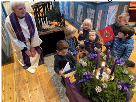
4-åringar ved adventskransen og stallen i Dovre kyrkje