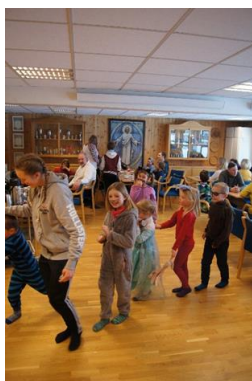
Karneval på Klukkarhaugen