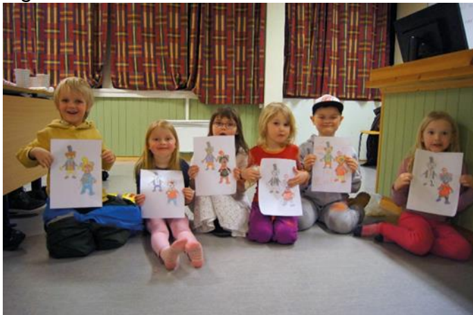
Barn med teikningar av Vesle og Fredo (dei to kyrkjerotter)