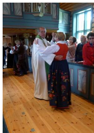
Folkemusikkmesse med dans