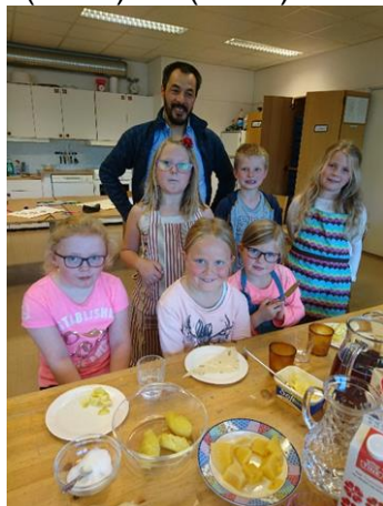
Velling, beta med poteter og kålrot smaker godt!