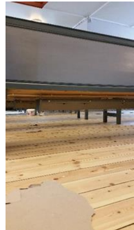
Nytt golv og ovner