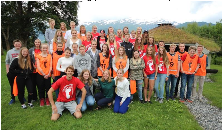
Flotte ungdommar er leiarar på konfirmantleir