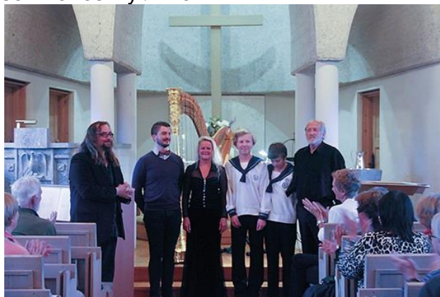
Requiem-utøvarar i Eysteinkyrkja