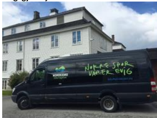
leirspor varer evig. . .