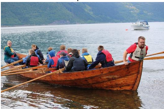
Leirsamarbeid i båt