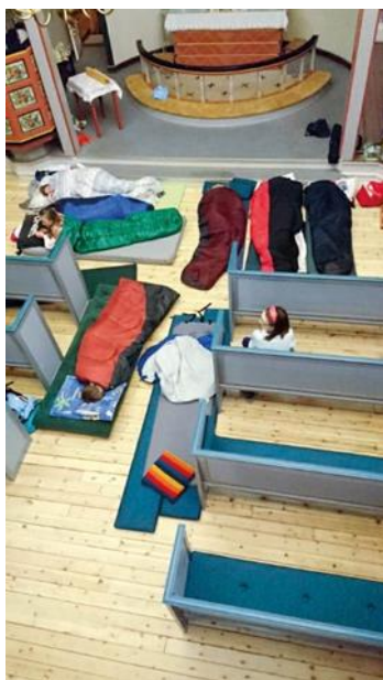
Overnattingsgjester i kyrkja