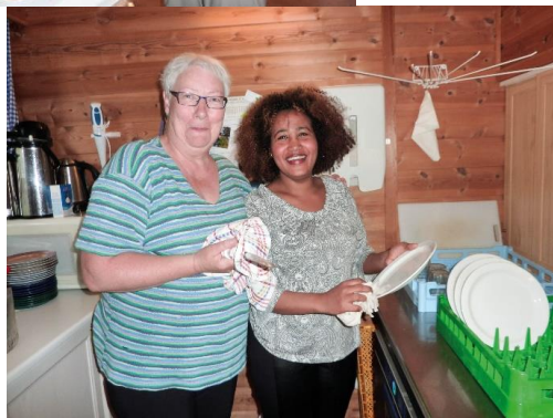
Matlagning, fristande bord, gode samtaler - og oppvask i fellesskap.