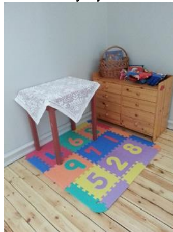
- med plass til barnekrok