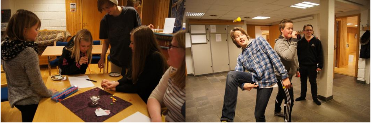
Aktiviteter på misjonsbasar