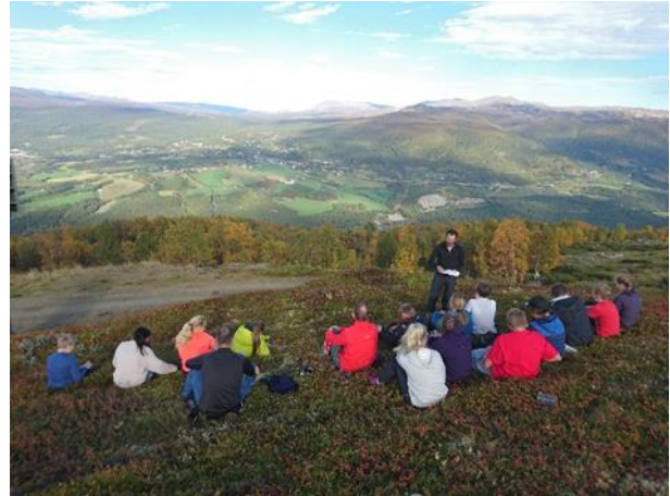
Felles perspektivtur til Hardeggsetra 13.9.