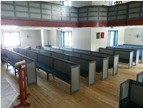
Ljost og «nytt» kyrkjerom