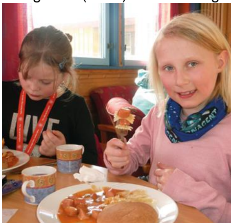
Tårnagenter koser seg med flaggermusgryte