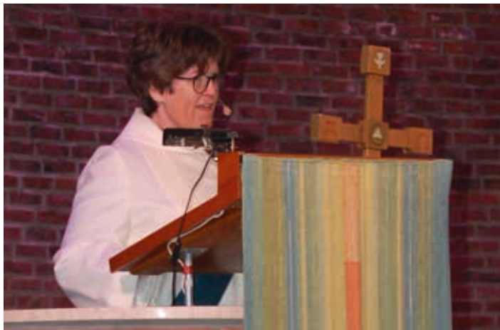
Ny diakon, fra innsettelses-gudstjenesten