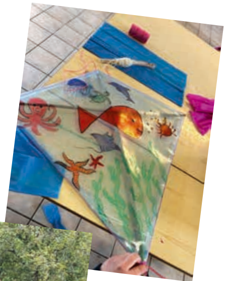
Vi lager drage

VI ØNSKER ALLE, NYE OG GAMLE, VELKOMMEN!