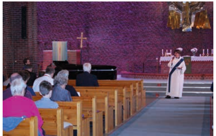
Vår nye diakon viste seg å være en svært god sanger!