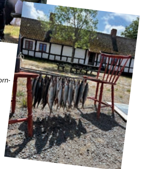
04 Speiderleir på Bornholm betyr sild!