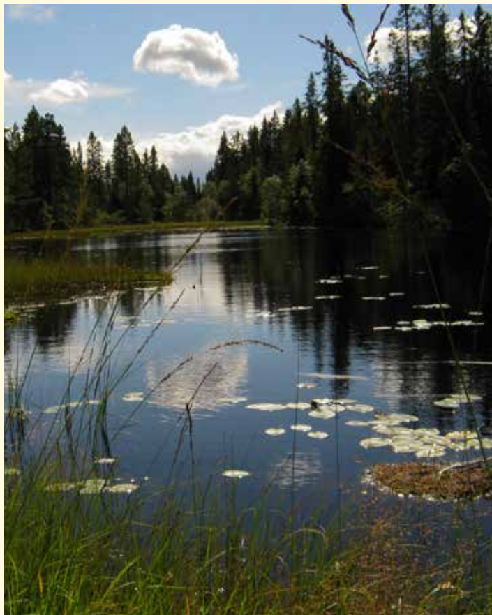
Gud så på alt det han hadde gjort, og se, det var overmåte godt

Populær er én ting, elsket er en annen. Fortellingene gjorde ham populær. Men lyrikken, særlig salmene, gjorde ham høyt elsket.