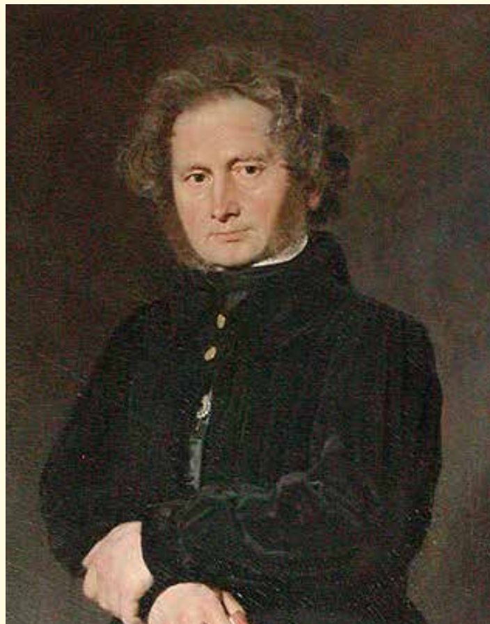
B. S. Ingemann, malt av C. A. Jensen