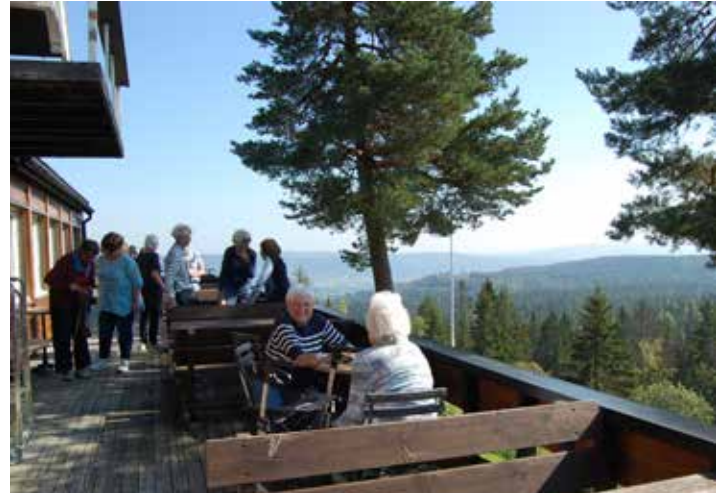
Torsdagstreff på Landfallhytta. 5. september

Alt dette tilbyr meningsfulle oppgaver for en rekke frivillige. Uten dem ville det ikke blitt noe av noe! Hvis noe frister, så ta kontakt med diakonen.