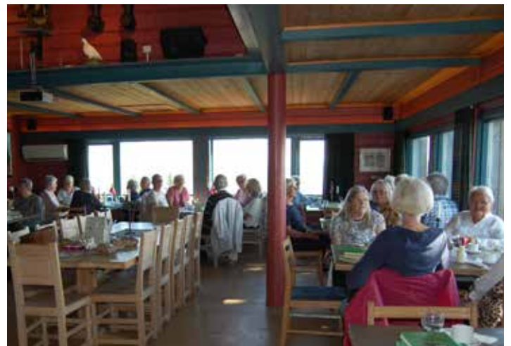
Torsdagstreff på Landfallhytta. 5. september