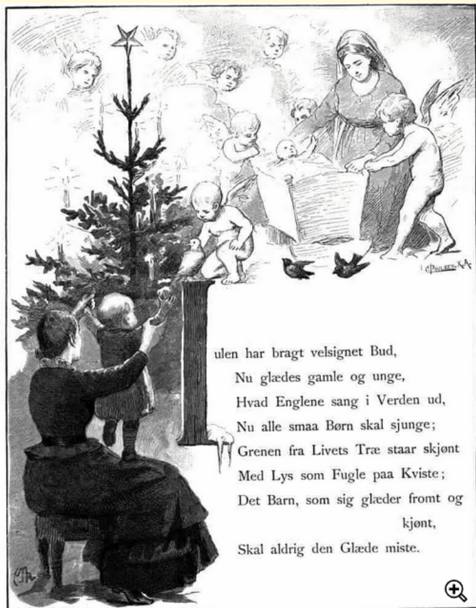
Julen har bragt velsignet bud

Musikkens verden, Store norske leksikon, Dansk Biografisk Leksikon