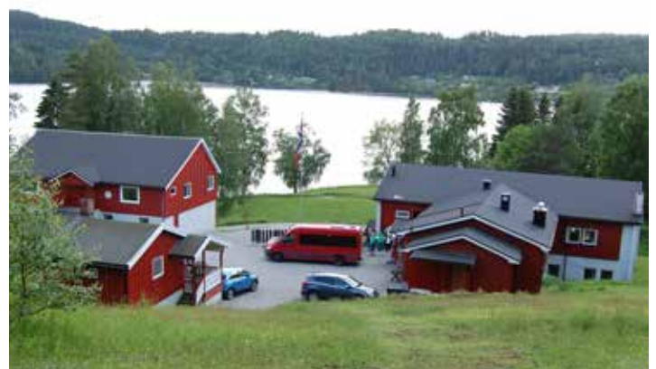
Torsdagstreff på Solsetra, juni 2024