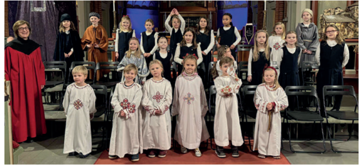
Lysmesse med Minores og aspirantkoret