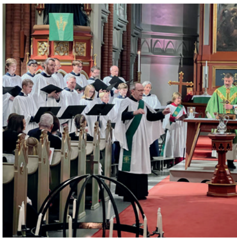
Familiemesse med guttekoret