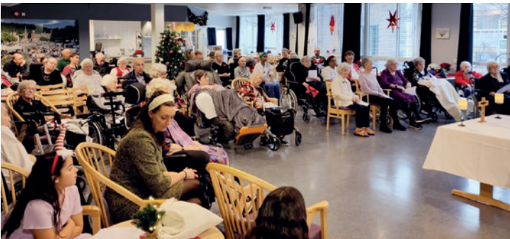
Julaftensgudstjeneste på Losjeplassen bo- og servicesenter