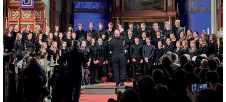
Musikklinjen ved St. Hallvard videregående julekonsert