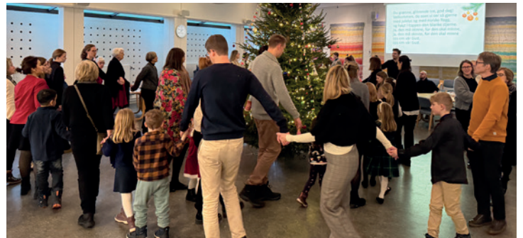
Juletreffest på menighetshuset