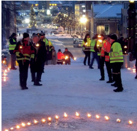
Markering av Trafikkofrenes dag i Buskerud - på torget og i kirken