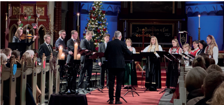
Midnattskonsert med solistensemblet lille julaften