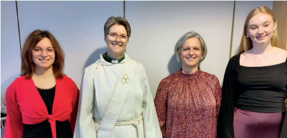
Medvirkende på julaftensgudstjeneste på Losjeplassen bo- og servicesenter