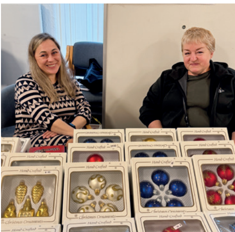
Salg av ukrainske julekuler på adventsmarkedet