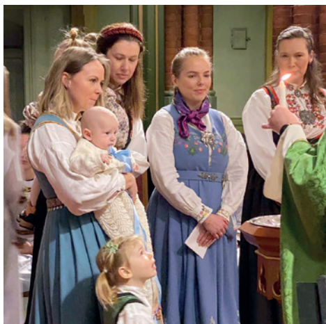
Her ser du et av de barna som døpes i Bragernes kirke (Ijengitt med tillatelse)