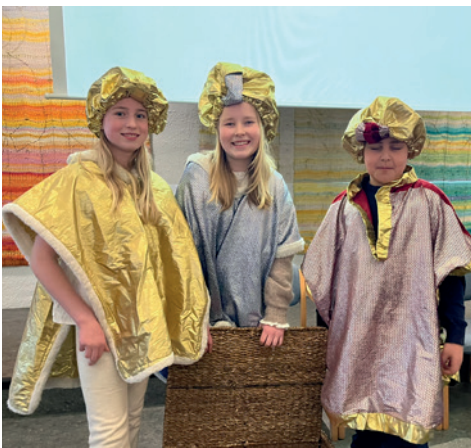
Tre hellige konger på juletefest