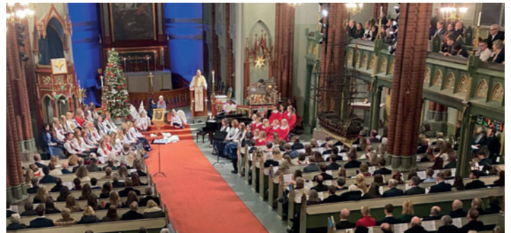
Over 2.000 var på de tre gudstjenestene julaften i Bragernes kirke