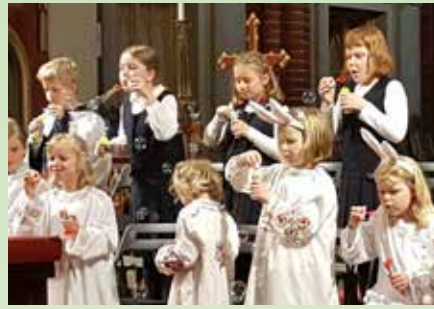
Familiemesse med Minores og jenteaspirantkoret