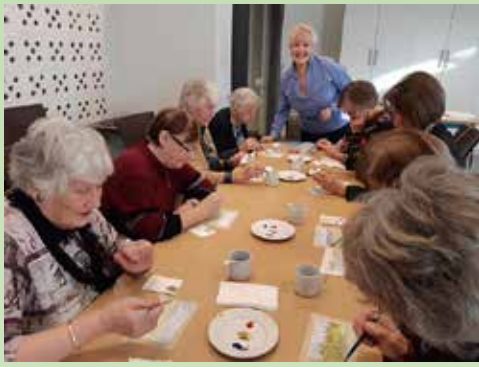
Akvarellkurs på formiddagstreff