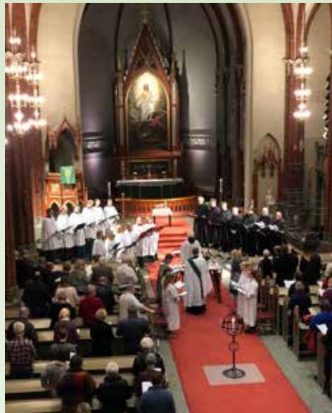
Solistensemblen og Collegium Vocale