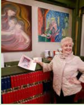
Utstilling av Zoja Sperstads malerier