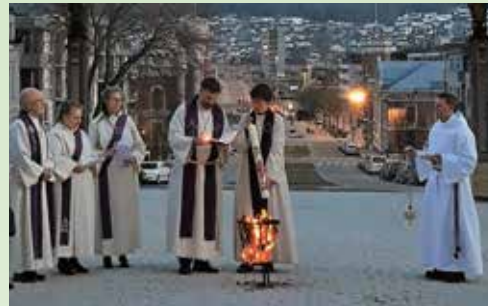
Velsignelse av ilden og tenning av påskelyset påskennatt