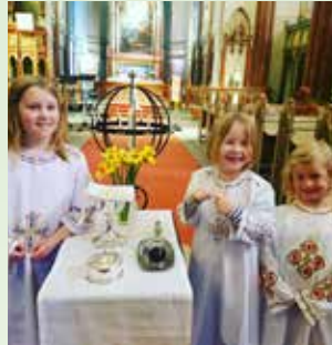
Glade ministranter 2. påskedag