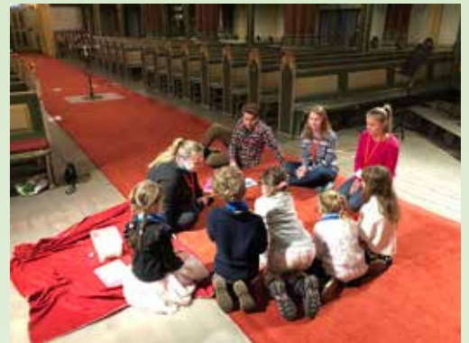
Tårnagenter løser mysterier