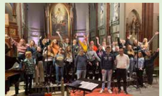
Cd-innspilling med ungdomskoret