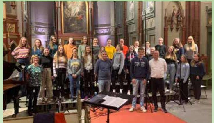
Ungdomskoret har nettopp begynt på en CD-innspilling.

Til høsten tar korene inn nye medlemmer: TA KONTAKT! I korene i Bragernes får du en god musikalsk opplæring, nye venner og musikalske opplevelser .