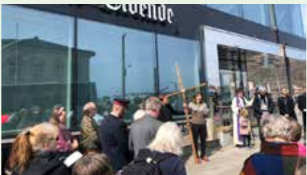
Felleskirkelig korsvandring langfredag