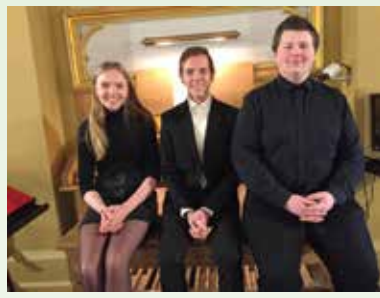
Konsert ved unge musikere fra St. Hallvard videregående skole