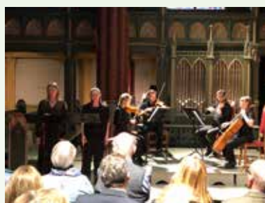
Konsert Stabat Mater av Pergolesi ved unge musikere