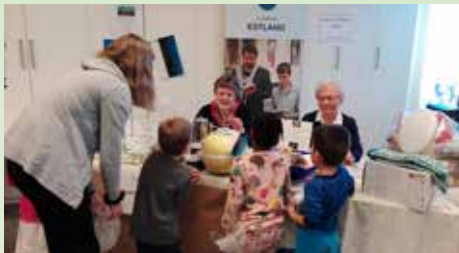
Misjonsbasar i Bragernes menighetshus