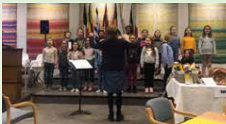
Jenteaspirantkoret synger på misjonsbasaren