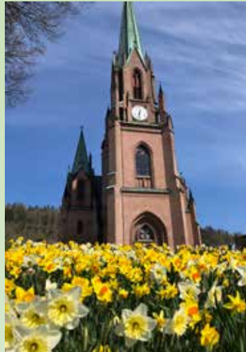
Påskestemning ved Bragernes kirke