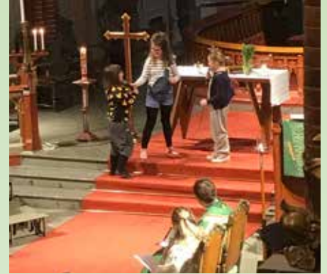
Dramatisering av jenteaspirantkoret