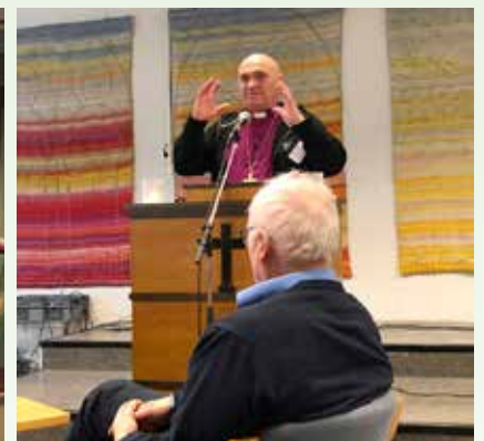
Foredrag ved biskop Jan Otto Myrseth i forbindelse med samling for prestene i bispedømmet