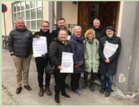
Støttemarkering ved våre naboer i den tyrkiske ambassaden etter terrorangrepet på New Zealand #tryggibønn