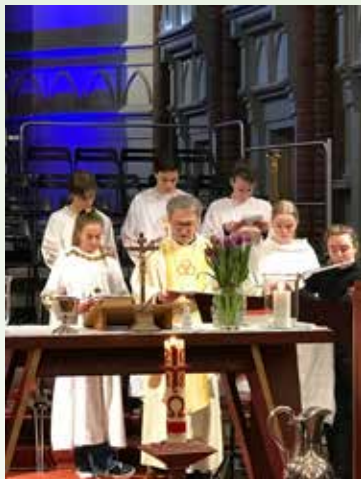
Høymesse med konfirmanter som ministrarer