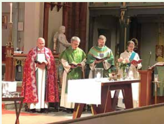
Messe ved biskop Jan Otto Myrseth i forbindelse med samling for prestene i bispedømmet