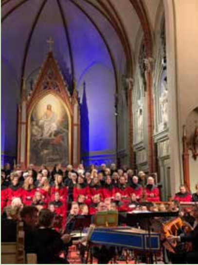
Skapelsen av Haydn