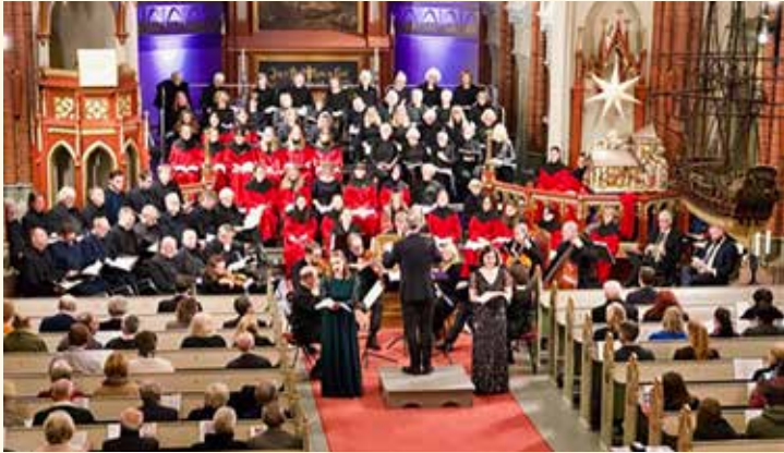
Adventsfestivalens åpningskonsert Händels Messias.