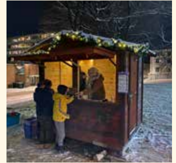
Åpning av julekrybba og servering av gløgg.