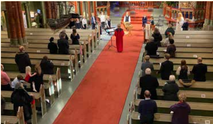
Fire julaftensgudstjenester ble gjennomført med maks 50 personer på hver.