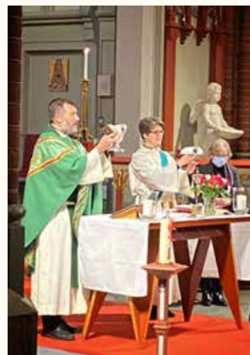
Fra nattverdsliturgien i høymesse med fokus på klima ifm Klimafestivalen.