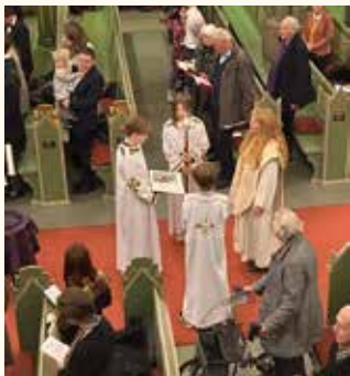
Evangelieprosesjon med ministranter.