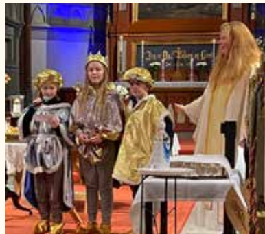
Samtale med de hellige tre konger.