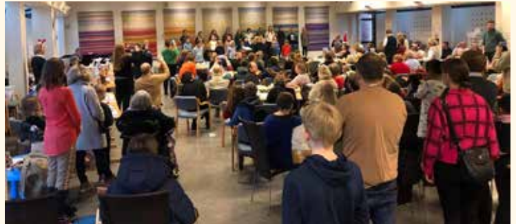
Endelig kunne vi ha Adventsmarked igjen.