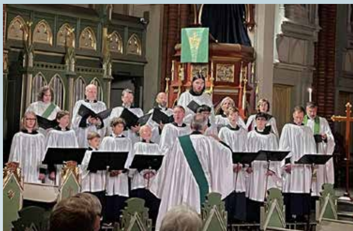
Evensong med guttekolet