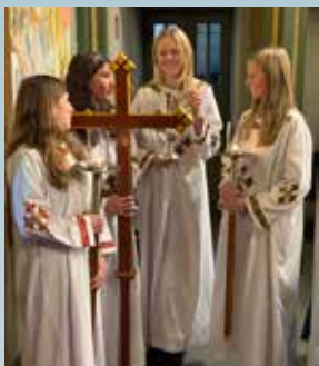
Ministranter før høymessen