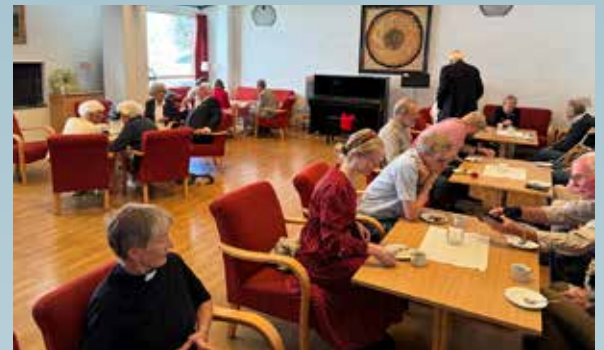
Kirkekaffe på menighetshuset