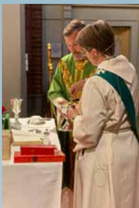
Pådekking til nattverd