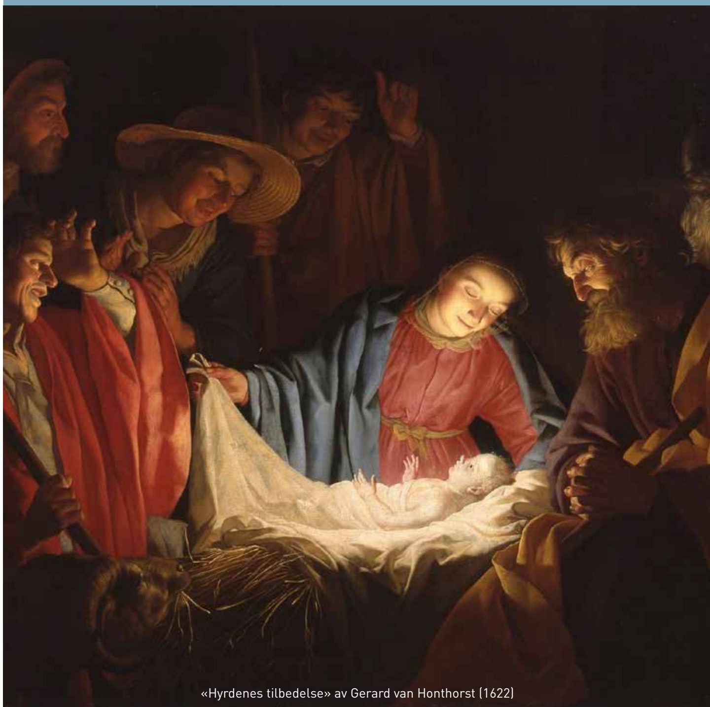
«Hyrdenes tilbedelse» av Gerard van Honthorst (1622)

Lysset skinner i mørket, og mørket har ikke overvunnet det