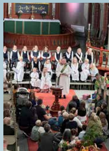
Familiemesse og høsttakkefest med Minores og aspirantene