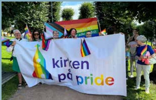
Kirken på pride