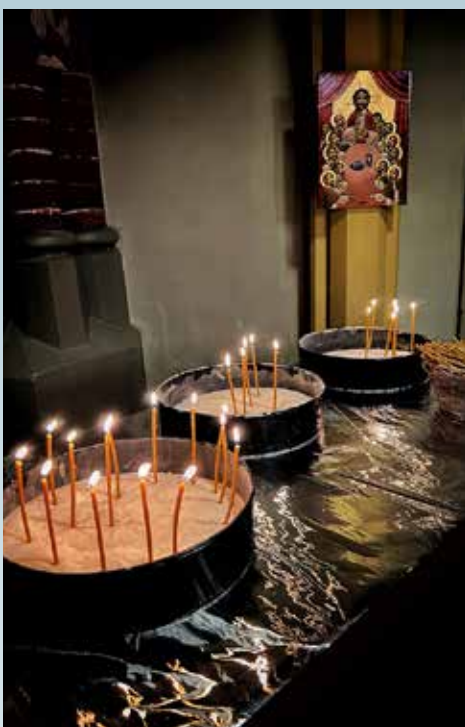
Allehelgensdag med Bragernes Kantori i Bragernes kirke