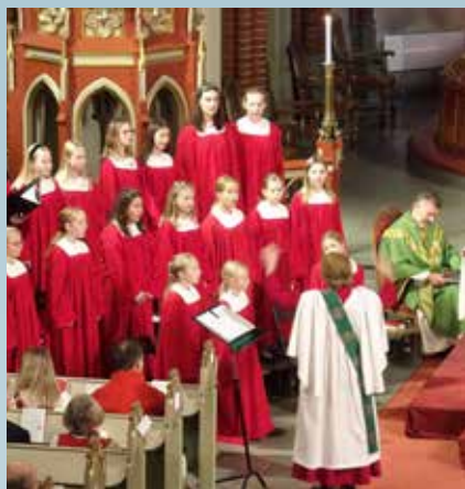
Jentekoret i familiemessen