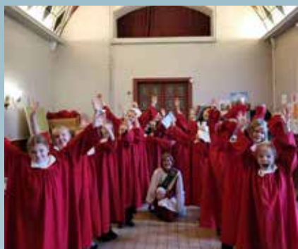
Jentekoret klare for familiemesse