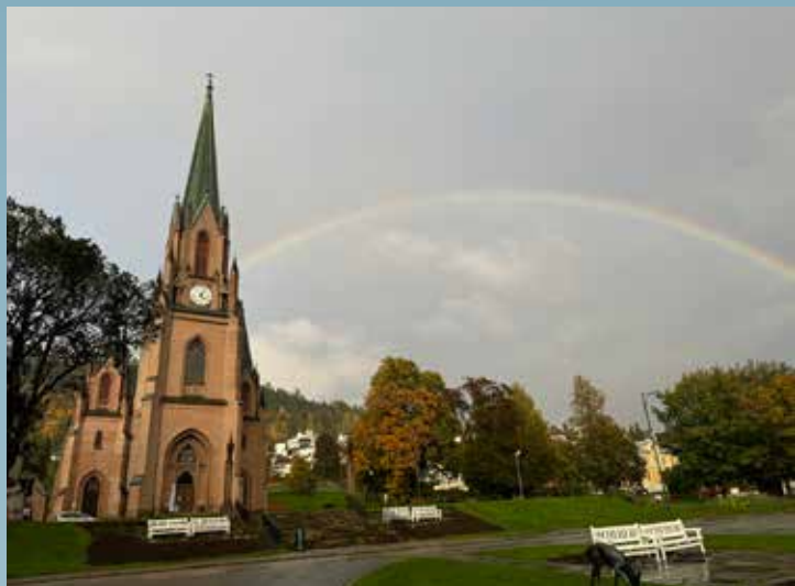
Regnbue over Bragernes kirke