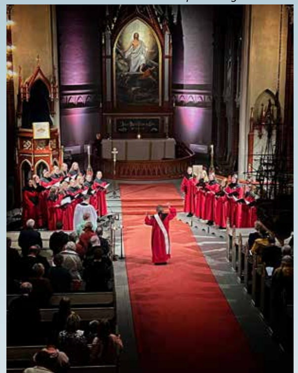
Evensong med ungdomskoret