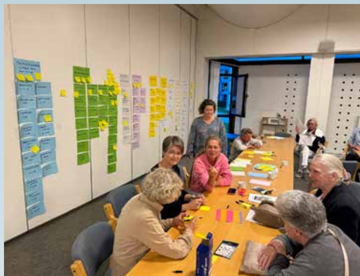
Workshop med stab og menighetsråd