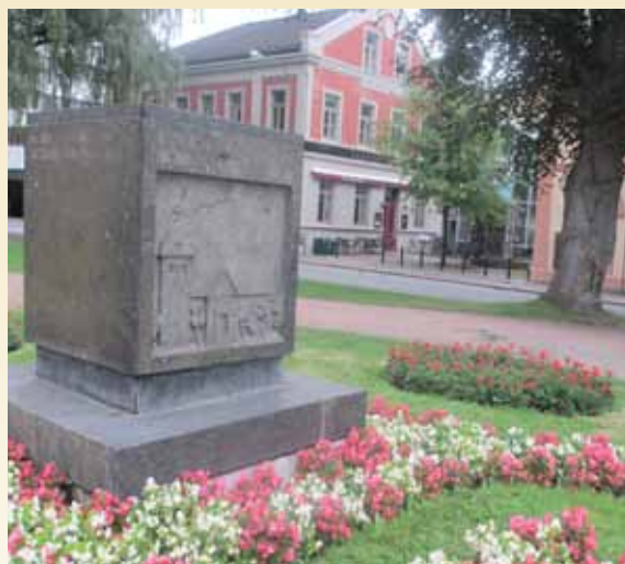
Monument over gamle Bragernes kirke, Hellige Trefoldighets kirke, på Gamle Kirkeplass (mellom Park Hotell og Drammens Teater).

Et storstilt hjelpearbeid ble straks satt i gang, og en telby ble reist for de 5000 husløse. Her holdt Jørgen Moe en friluftsgudstjeneste første søndag etter brannen.