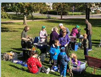
Høst i Kirkeparken – for store og små