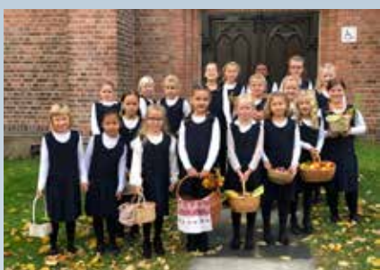
Høymesse med Bach-kantate på Mikkelsmess. Samarbeid med Ad Fontes