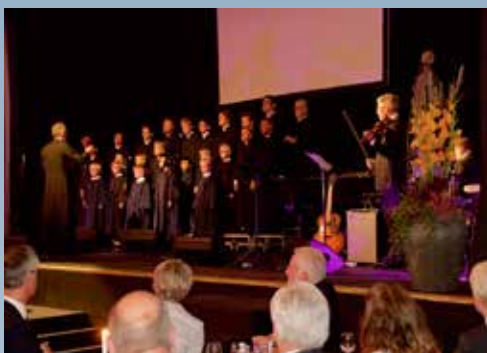
Guttekoeret synger for nye biskop og kongen på kirkekaffen etter bispevigslingen