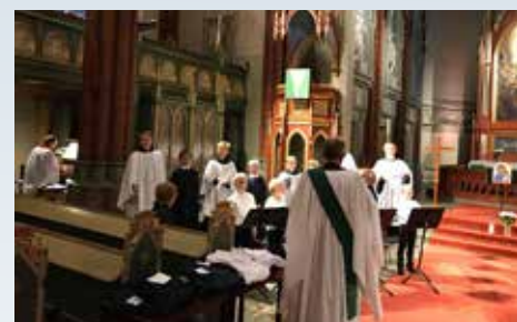
Evensong med opptak av nye korgutter