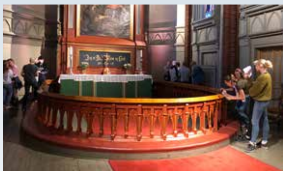
Konfirmanttime om kirkerommet