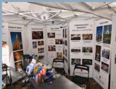
Kirken på plass på Elvefestivalen