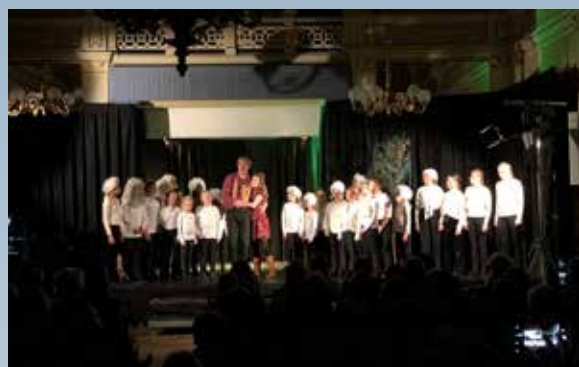
Familieforestillingen «Mozart med tryllefløyten» med jentekoret. Samarbeid med Ad Fontes