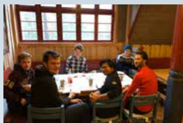
Tur til sportskapellet med guttekoeret