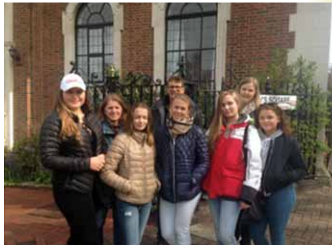
Utenfor sjømannskirken i London.

8.-12. april dro en flott gjeng med 17-årige jenter og tre voksne ledere på tur til London. Turen markerte avslutningen på en to-årig lederopplæring i Konnerud og Skoger menigheter. Jentene har gått et år på MILK (minilederkurs) og har hatt et år med et kursopplegg som kalles «Oppreist tro». Dette var fjerde gruppe som fullfører kurset og tredje gjeng som avslutter i London. Vi hadde et tett program med varierte opplevelser. Selvfølgelig var vi litt turister på sightseeing og shopping (vi hadde tross alt med oss tenåringsjenter!), men hoveddelen av turen gikk med til ting som er relatert til lederopplæringen vår. Derfor besøkte vi tre menigheter, blant annet den norske sjømannskirken, hvor vi fikk med oss både gudstjeneste, konsert og et engasjerende foredrag om