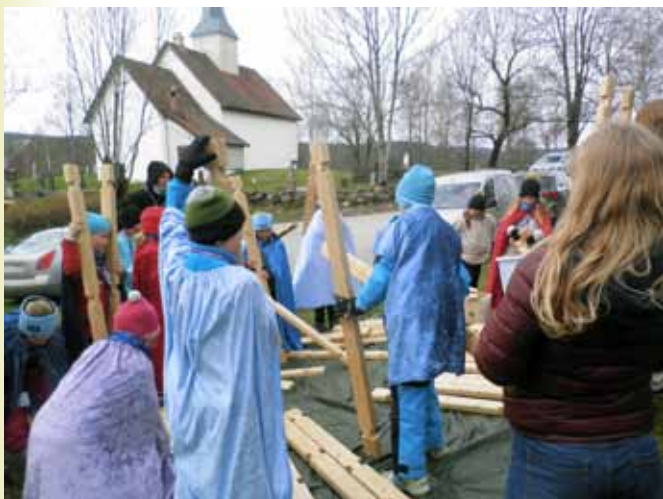
Tidsreise: Vi dro tilbake 850 år i tid, til før Skoger gamle kirke ble bygget og grublet litt på hvorfor Skoger-folket ønsket seg en kirke og hvorfor den ble bygget akkurat der den ligger.

Tårnagentenes motto er: «Vi skal jobbe for det gode, bruke hjertet, bruke hodet. Bibelen har gode ord, vi skal sette gode spor. Ikke bare tenke på oss selv, men hjelpe andre. Du og jeg kan gjøre en forskjell, vi kan forandre, noe der vi bor, sette gode spor, slik at andre får en himmel over livet.»