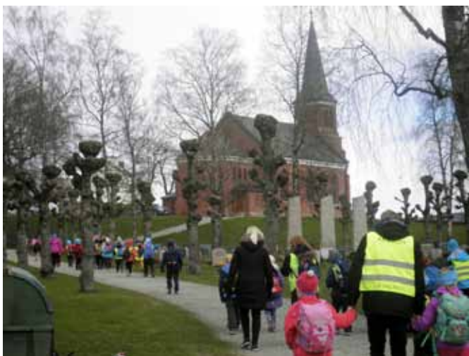
På vei mot framtiden: I 1885 sto Skoger kirke ferdig. Tårnagentene har lært at Guds folk til alle tider og alle steder på jorda, bygger kirker. Derfor fikk de også høre om Barnas kirke i Kumin i Thailand som ble bygget i 2015, og de samlet inn penger som er sendt til barna i denne kirken.