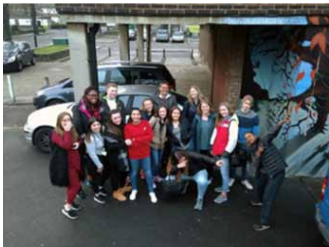
Fra ungdomsklubben på Bede-House London.

sjømannskirkens grunntanke og historie. Vi var også på besøk i det norske KFUK-hjemmet. Dessuten hadde vi flere bolker med undervisning før vi avsluttet det formelle programmet med et besøk på en ungdomsklubb i en marginal bydel i Sør-London. Det ble et sterkt møte med jevnaldrende som ikke lever så langt unna oss, rent geografisk, men som likevel vokser opp i en helt annen virkelighet enn den norske gjennomsnittstenåringen gjør. Møtet med ungdommene og ikke minst de entusiastiske og idealistiske lederne i denne ungdomsklubben, skapte et engasjement hos ungdommene våre, og snart blir det kanskje både loppemarked og andre aksjoner for å samle inn penger til ungdomsklubben i Bede House. Og så drømmer vi litt om å få noen fra Bede House til å komme på besøk til oss.