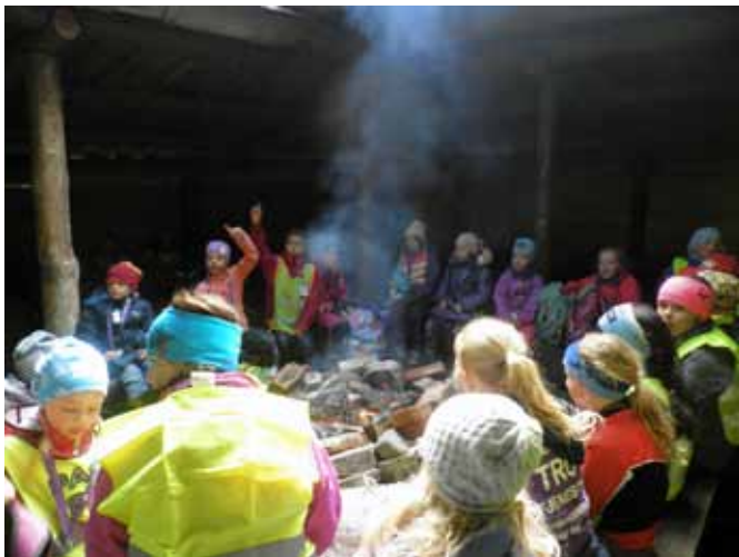
Grilling av pølser og lek i skogen ble det også tid til på tårnagentensøndagen. Takk til Skoger IL som lot oss låne gapahuken på Sletta!