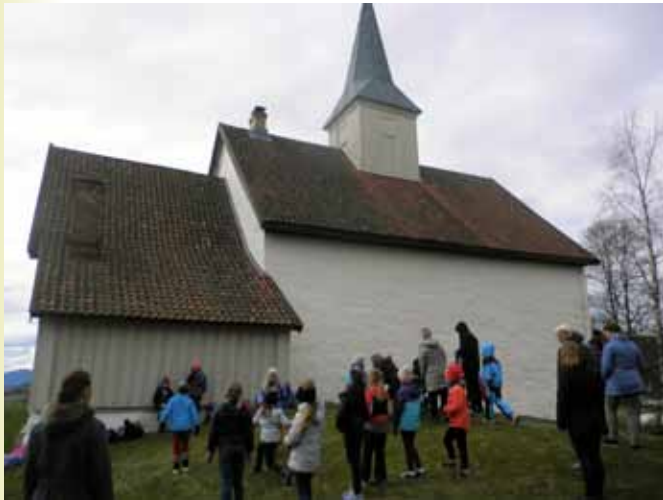
24. april var 35 barn fra Konnerud og Skoger med på Tårnagentensøndag i Skoger.