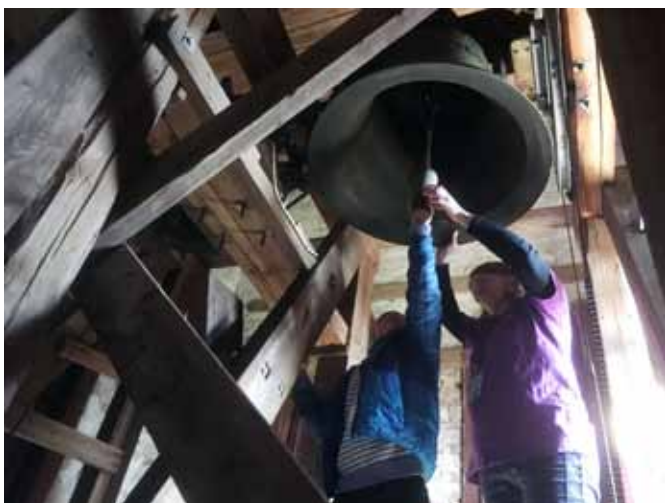
Det står noe på alle landets kirkeklokker, men det viktigste budskapet kirkeklokkene har, er å kalle alle folk til gudstjeneste. Kirken er huset, og kirken er også menneskene som hører til i huset.