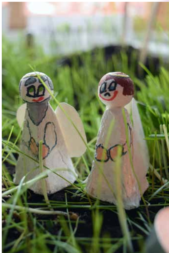
Fra Amicus barnehages påskelandskap.

Nåden lar fortid være fortid - og lar framtiden ligge åpen og spennende foran oss. At fortiden er borte betyr ikke at den er gjemt, stuet bort på et