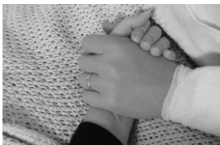
En trygg hand å holde i.

ikke funnet primærkreften. Etter nye undersøkelser fant de ut at det var kreft i tykktarmen og at den var veldig aggressiv.