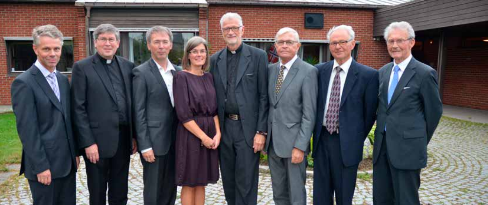
Tidligere og nåværende tjenestegjørende prester i Mjøndalen menighet.