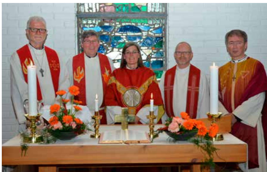
Tjenestegjørende prester under jubileumsgudstjenesten 15. september.

Onsdag 11. september inviterte menighetsrådet til jubileumsfest for frivillige medarbeidere. Senere på kvelden ble jubileumsverket «Strømmer av levende vann» urframført. Jubileet ble avsluttet med gudstjeneste søndag 15. september og en fullsatt kirke ble beriket med vakre toner og en livsnær preken. Etter gudstjenesten tok over 130 personer del i kirkekaffen med hilsener og gode samtaler. Det ble også tid til et tilbakeblikk på de 30 årene som har gått siden Mjøndalen kirke ble vigslet til tjeneste.