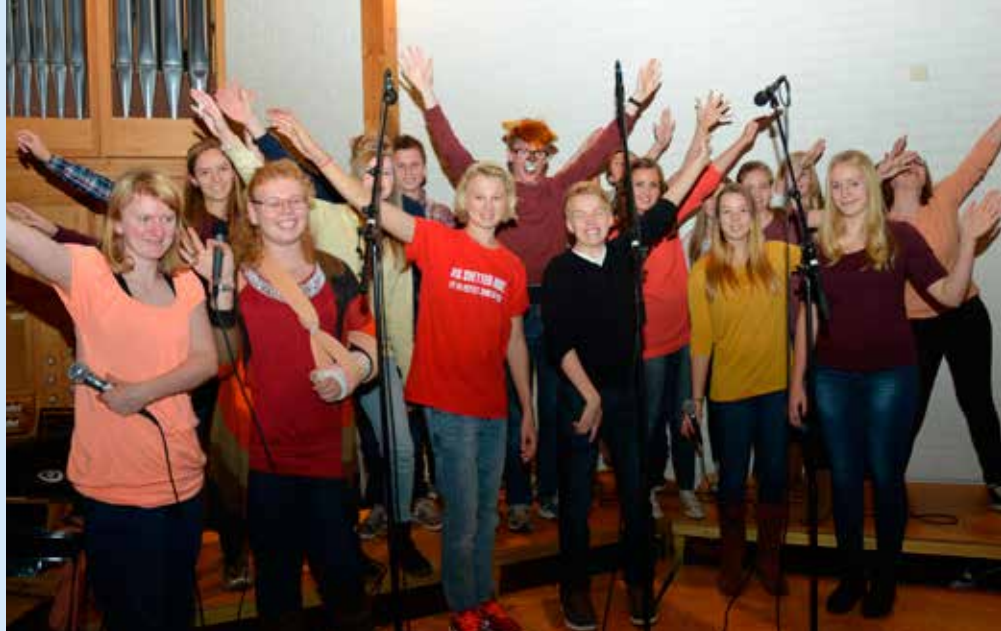
NETS og konfirmanter fra gruppe 1 sang sammen på «Ung messe» søndag 17. november.