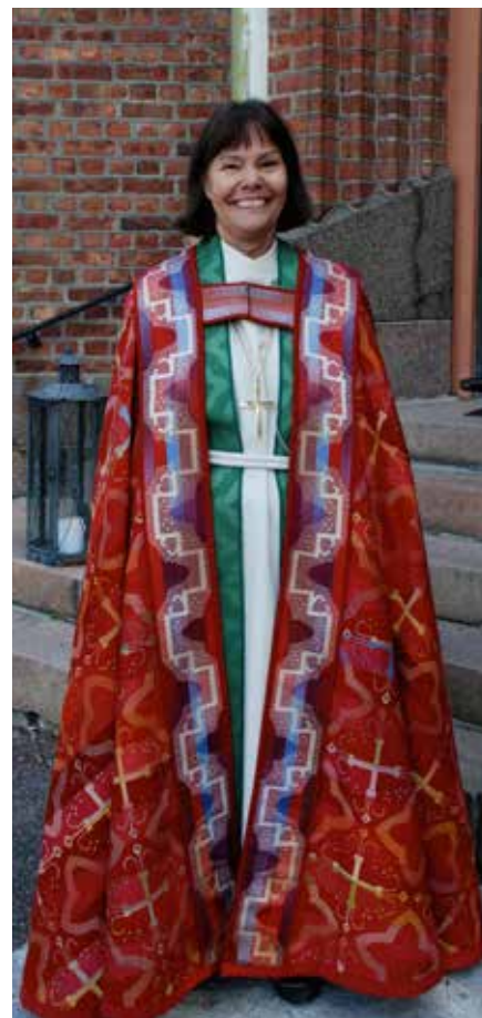
Biskopen i den nye bispekapen.

Guds lys er i vår verden. Han som lå i krybben, er i sin kirke. Han viste hvem han var ved sin oppstandelse. Julebudskapet og påskebudskapet utgjør et hele. De utfordrer oss til å tro på ham som kaster lys over vår tilværelse. Vi utfordres til å se alle ting i lyset fra hans oppstandelse. Det endrer vår oppfatning av tilværelsen; det gir lys og håp inn i vår verden.