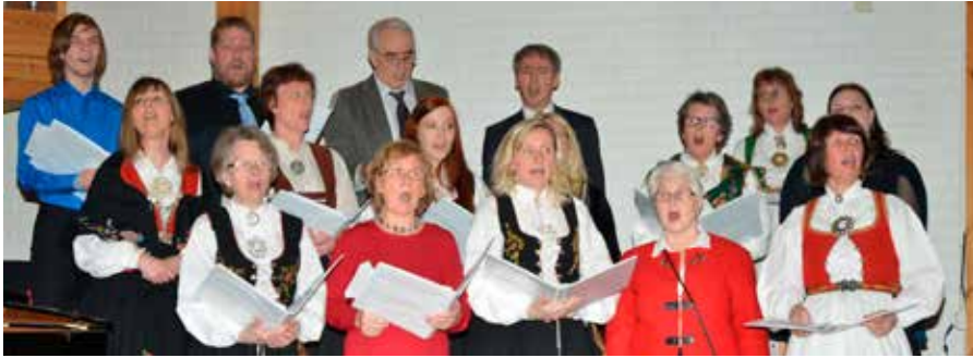
Et sammensatt prosjektkor løftet salmesangen under festgudstjenesten.