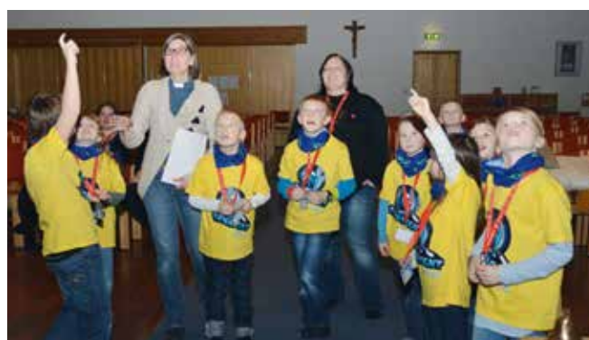
En av oppgavene til agentene var å utforske kirkerommet. Her er det glassmaleriet som undersøkes.