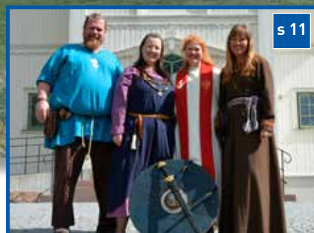
Kvitekrismesse i Nedre Eiker kirke