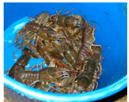
Kreps fanget i Hagatjern under krepseleiren.

Det gis kr 50 i rabatt for søskenmoderasjon, eller ved medlemskap i leirklubben. Ved spørsmål, kontakt: rdo@nms.no eller tlf.: 22 57 85 50.