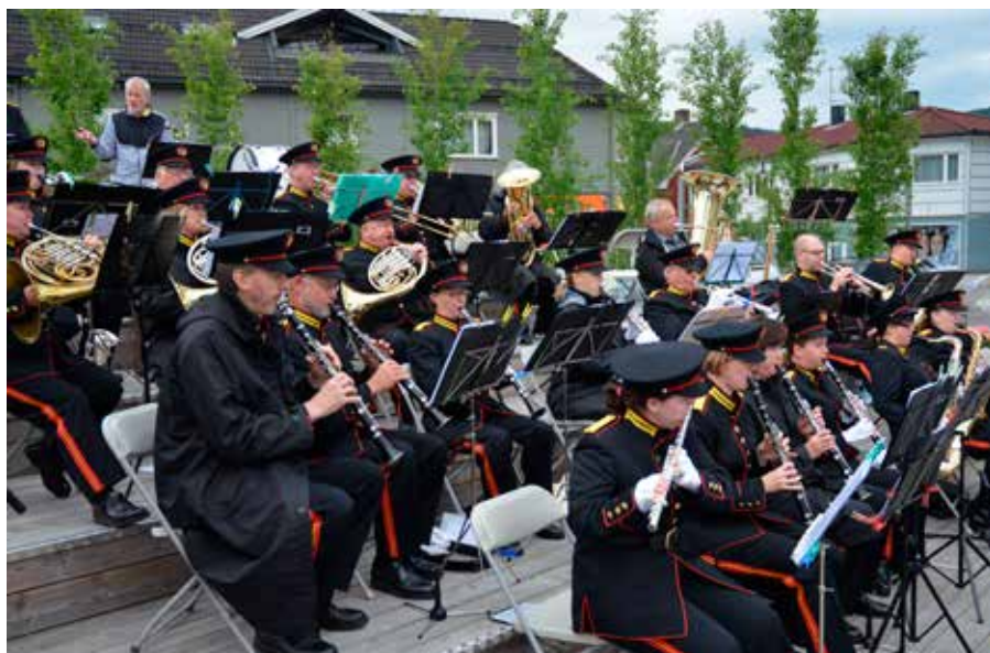
Glassverket musikkorps deltok under torgmessen i 2014 med friske sambatacter og variert korpsmusikk. I år er det Eiker janitsjar som bidrar musikalsk.

Og som tradisjonen har blitt, ringes det fyldig inn til Torgmessen fra klokkene i både Nedre Eiker kirke og Mjøndalen kirke – i en appellerende duett – og i samarbeidets ånd.