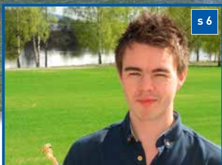
Trompetvirtuos med beina på jorda