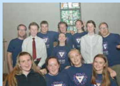
Medlemmer og to av voksenlederne i Nets i juni 2019.

I anledning 30års jubileet til NETS blir det konsert i Mjøndalen kirke lørdag 7. september kl. 19.00. Det vil bli musikalske innslag av tidligere og nåværende NETS'ere. Her blir det store muligheter til å treffe gamle kjente, synge sammen eller bare nye god musikk. Etter konserten blir det sosial happening med ulike innslag og bevertning. Jubileumskonserten ble flyttet fra juni til september på grunn at det var få tidligere NETS'ere som hadde anledning til å delta. Følg med på Nedre Eiker Ten Sing sin Facebookside, for nærmere informasjon.