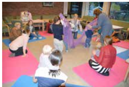
Mylderbarn i aktivitet.