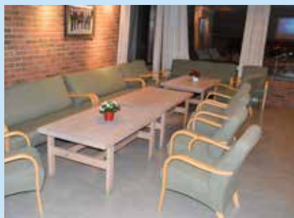
Peisestua er en koselig møteplass

Ta gjerne kontakt med kirkekontoret, telefon 32 23 68 60, for mer informasjon, priser og muligheter for øvrig.