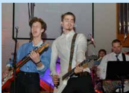
Arkivbilde av bandet i NETS april 2016

Lørdag 7. september kl. 18.00 i Mjøndalen kirke