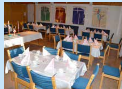
Kirkestua rigget for fest