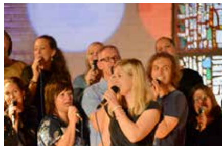
Gleden med å syngre er fremdeles intakt.

Har du lyst til å være med? Vi øver i kirken hver fredag kl. 18.00 – 21.00.