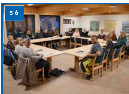
Nytt menighetsråd på plass