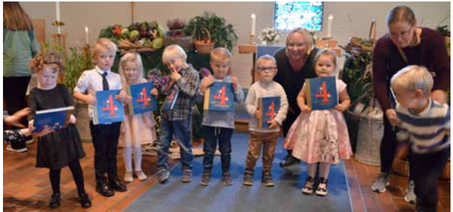
Mange 4-åringene møtte opp til familiegudstjenesten 15. september.

Er en heldagssamling i kirken for 3.-klassinger. Som tårnagent får du være med på å løse mysterier og spesielle oppdrag, spise og ha det gøy sammen med jevngamle. Tårnagentene skal også lage og være med på gjennomføring av en kveldsgudstjeneste for hele familien.