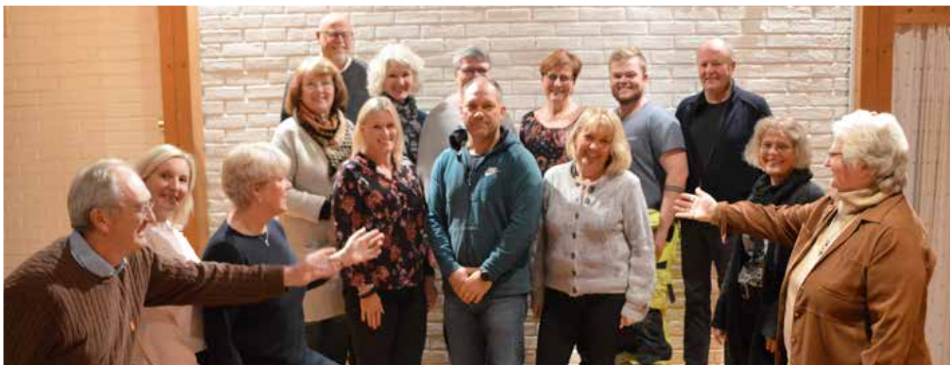
Avtroppende menighetsråd presenterer de som skal overta styringen av Mjøndalskjerka.