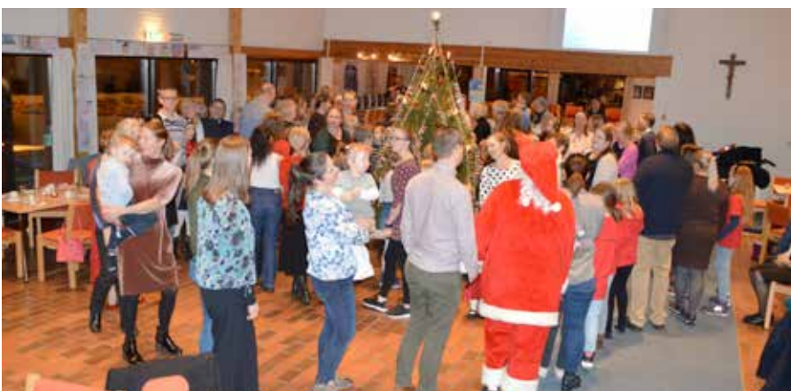
Fullt hus på forrige juletreffest.

Så kommer den svært så tradisjonelle juletreffest med 4 ringer rundt jule-treet, kaffe og julekake, og småunger som løper rundt treet i finkjoler med bekymrede besteforeldre i vaktposisjon. 2. januar er fast dag, og for ett år siden opplevde vi en skikkelig «juletreffestbonanza» med nær 150 mennesker til fest. Det er plass til flere, så merk deg dagen og tidspunktet 16.30.