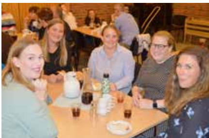
Hyggelig å treffe gamle venner etter konserten.

Etter konserten var det samling i ungdomsalen med et storslagent kakebord og mye mimring om «NETS-minner» mellom gamle venner.