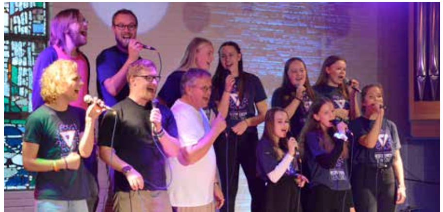
Dagens NETS med engasjert støtte fra voksenlederne