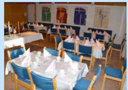
Kirkestua rigget for fest

Ta gjerne kontakt med kirkekontoret, telefon 32 23 68 60, for mer informasjon, priser og muligheter for øvrig.