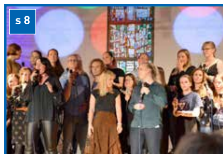
NETS-jubileum med trøkk