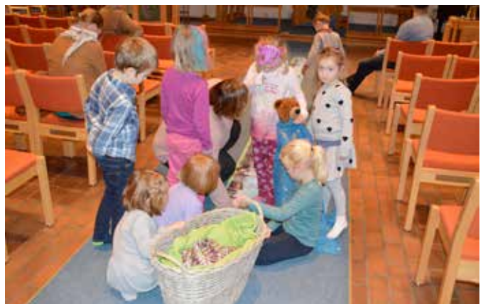
Mylder er aktivitet