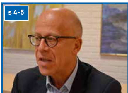
Møt vår nye kirkeverge

Ansatte i kirken ha fått nye e-postadresser. Dessuten får alle medarbeidere nye telefonnumre fra 1. januar 2020. Du finner mer informasjon inne i bladet.