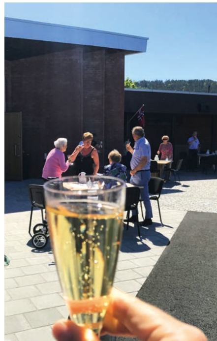
Det nye anlegget ble innviet med boblevann.