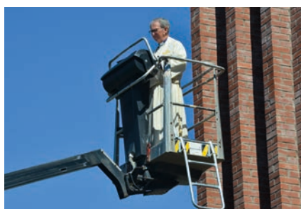
Prosten i lift for å stenke vievann på tårnet.

Det å komme inn mot kirken fra Vikveien viser nå et inngangsparti med store vinduer og dobbel dør, et innbydende utvendig kirketorg med fastmonterte benker og et flott tårn. Og i strålende sol denne moidagen ble torget innviet med kirkekaffe, marsipankake og boblevann.