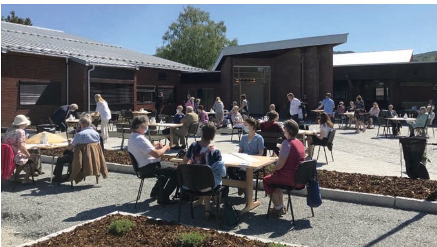
Over: Torget er godt egnet for kirkecaffe.

Det har vært en spennende tid og veldig moro å jobbe sammen med dere alle sammen!! Her snakker vi om ildsjeler med brennende engasjement for saken. Det er helt nødvendig med slike mennesker i arbeid for at man kan kunne nå en drøm og et mål. Mjøndalskjerka hadde disse ildsjelene, og det ser vi resultatet av i dag!