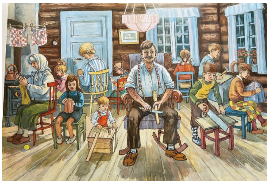
«Hemmeligheten» av Johan Vestly

bøker og far med tegning og maling. I en liten leilighet kunne det by på ordensutfordringer, men jeg husker at lillejulaften ryddet far tegnebordet sitt og pyntet det med duk og levende lys. Da var det jul. Må forresten legge til at mors forfatterskap ikke har så mye stoff om jul, men noen historier finnes. Som en episode med de 8 ungene. De hadde jo ikke råd til å kjøpe julegaver, men måtte lage dem selv. Til hverandre. Og det skulle selvsagt være hemmelig fram til julaften. Fars tegning av julegaveproduksjonen – i hemmelighet med ryggen til hverandre – er kostelig.