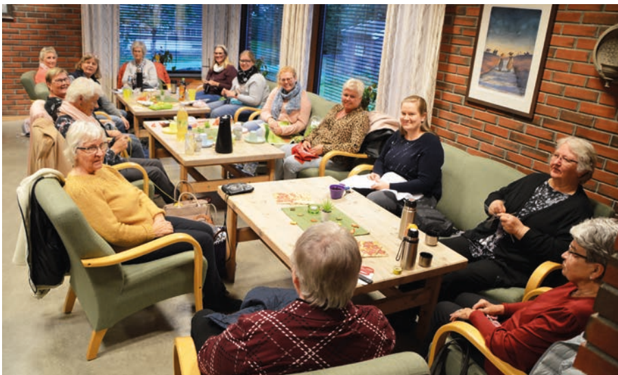
Håndarbeid er godt, sosialt fellesskap.