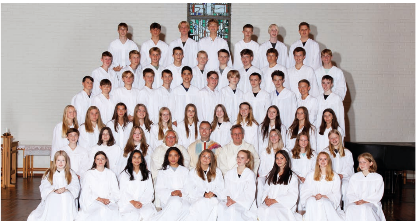
Konfirmanter i Mjøndalen kirke høsten 2021.