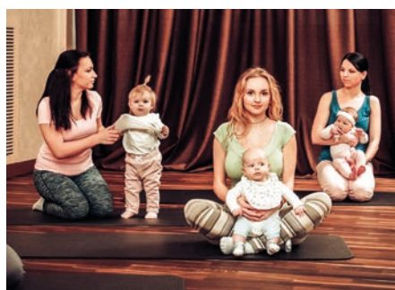
Babysang starter i Mjøndals- kjerka s 10