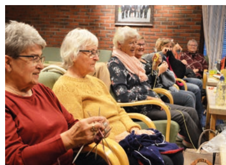
Bli med i strikkeklubben. s 6