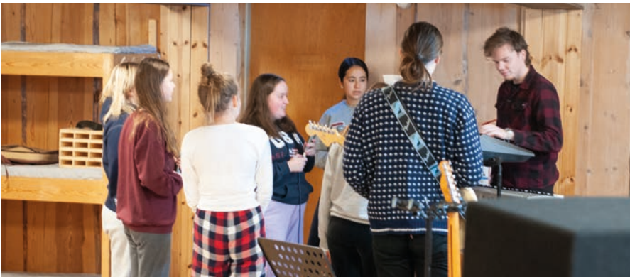
Fra høstens helgetur på Beitostølen: Mye god øvelse i å samles rundt et keyboard og en gitar.

Dette er en årlig innsamling til Kirkens Nødhjelp som konfirmandkullene i Mjøndalen kirke deltar i sammen med mange andre menigheter. Innsamlingen skal skaffe rent vann til barn, og i 2021 ble det samlet inn mer enn 23 millioner kroner totalt under Fasteaksjonen, selv om den foregikk mer eller mindre digitalt. Innsamlingsrekorden i Mjøndalen er vel 46 000 kroner på en hverdagskveld. Ta godt imot konfirmandene våre når de banker på døra di tirsdag 5. april.