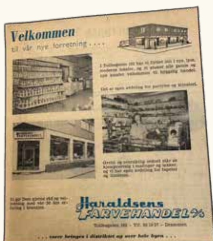
Bildet viser en annonse fra ca 1960.

de vanligste malingstypene så langt tilbake i tid. Det viste seg fort at interessen for malingen var så stor at hun og hennes mann Erling startet familiebedriften.