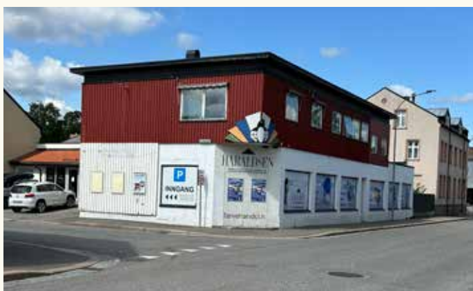
Butikken i dag.