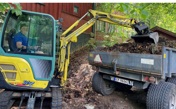
Ved å sortere avfall når vi steller gravene, gjør vi det mulig å lage kompost.

I tillegg kan det bestilles krans og lystenning til allehelgenssøndag og jul. Det kan leses mer om dette tilbudet på kirkens nettside.