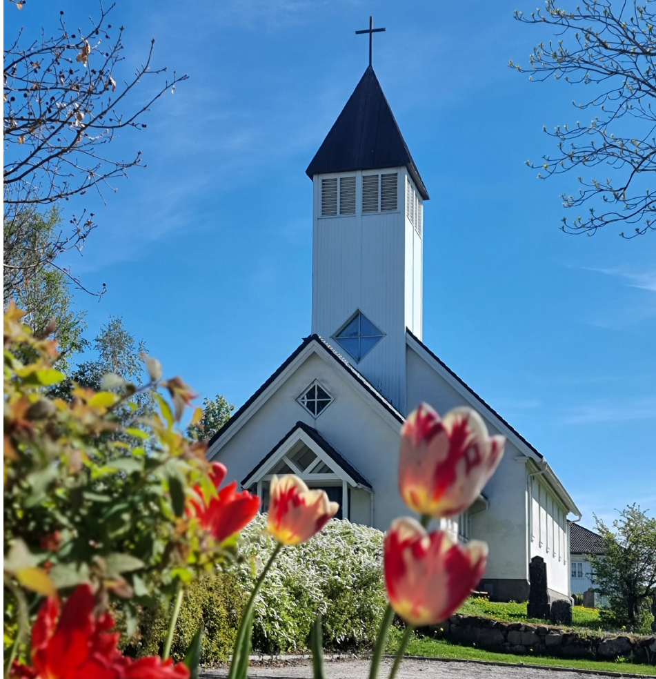
Frogn kirke.