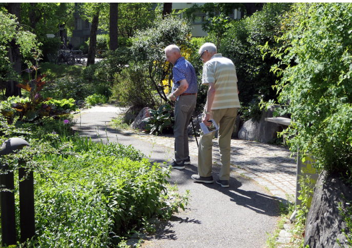
Statue av Cathinka Guldborg