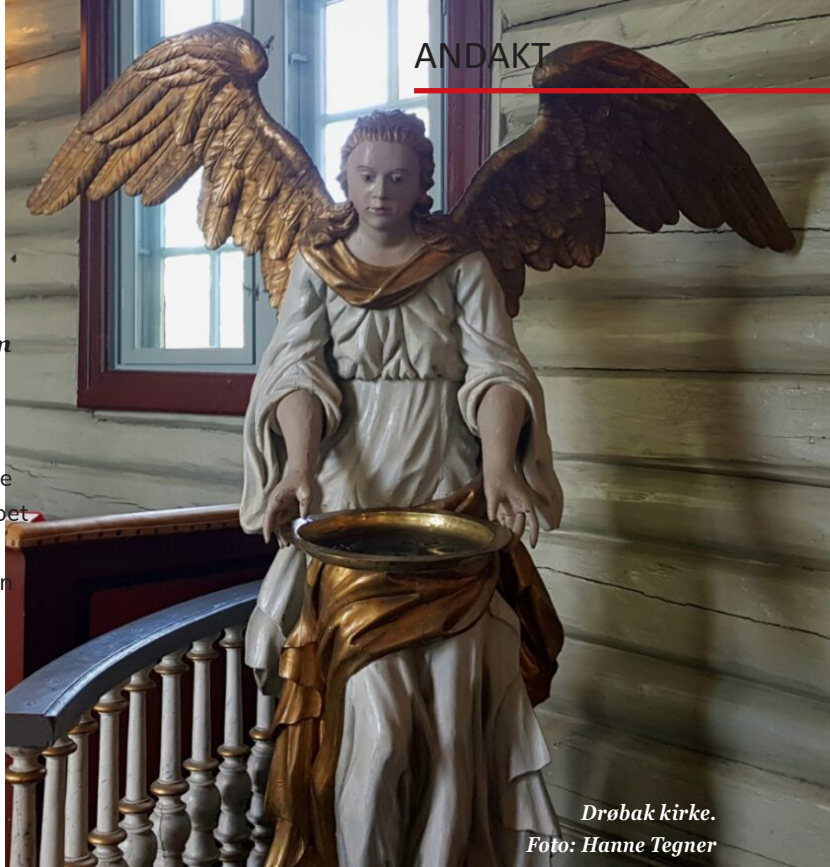
Drøbak kirke.