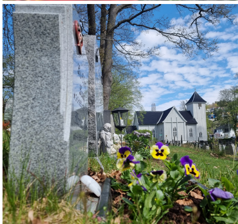
Grav med stellavtale med selv vanningskasse.