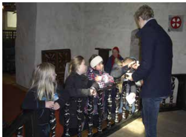
Sjefsagenten forteller om alteret (t.v.). Dagen ble avsluttet med grillpølser og saft.

Neste år inviteres nye tredjeklassinger til en opplevelsrik tårnagentdag i Enebakk kirke.