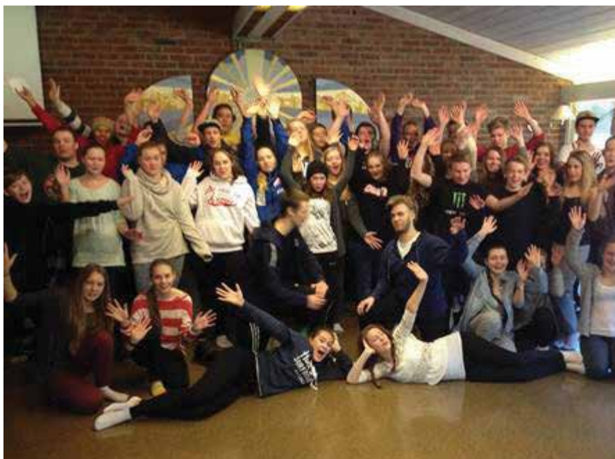
Flott konfirmantgruppe i Mari.

De fikk prøve seg på bibellesning, bønn, lovsang og