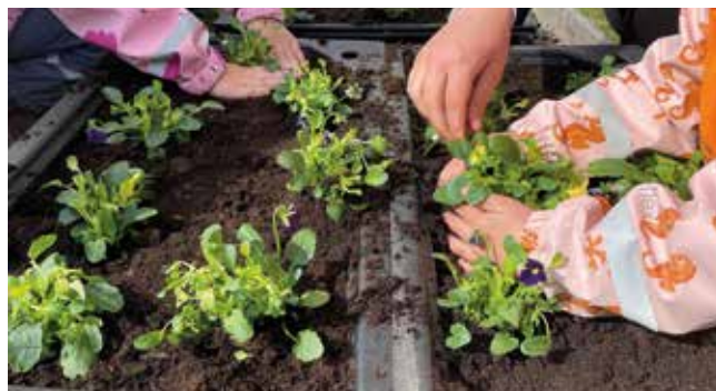
Snart tid for å plante i Barnas blomsterhage

Om noen år er nok dette problemet løst, og tilgjengeligheten til aktuelle maskiner vil bli større enn i dag. Vi kan fylkeskommune har også hjulpet oss med utlån av batteridrevet utstyr, slik at vi kan få sjekket hva som er vårt behov, og hva vi bør kjøpe inn ettersom vi har mulighet til det.