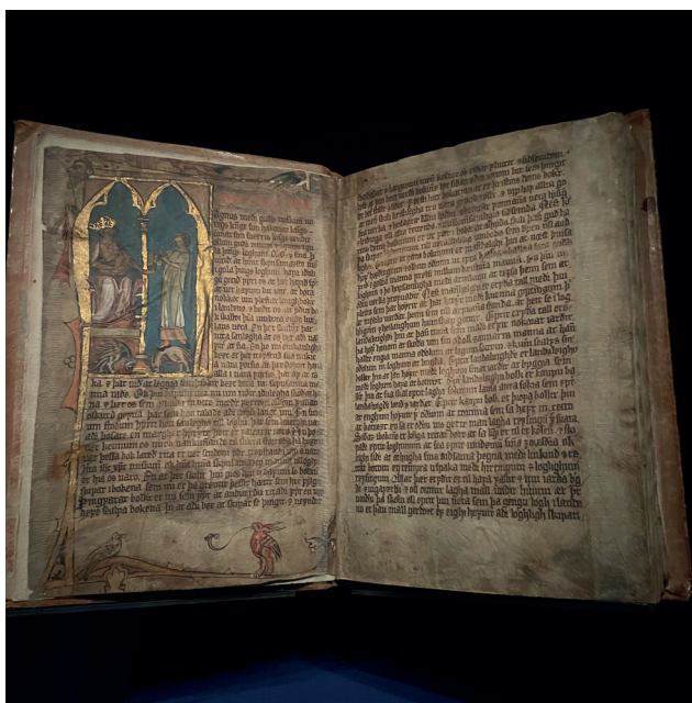
Codex Hardenbergianus med flotte illustrasjoner. Boken ble skrevet omkring år 1300.