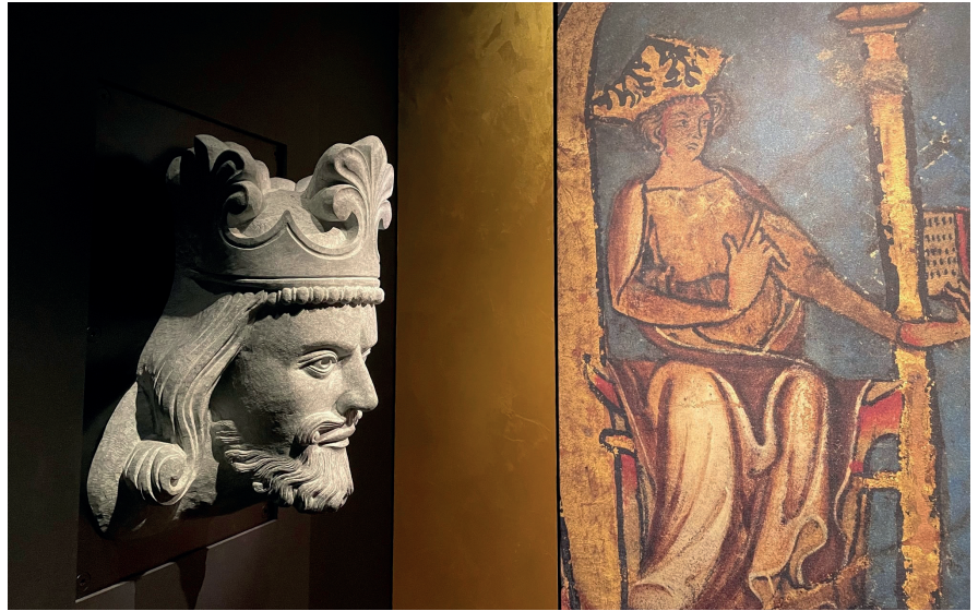
Steinhode av Magnus 6. Lagabøte Håkonsen. Skulpturen henger i Stavanger domkirke, og denne kopien er laget for jubileumsutstillingen av steinhuggere fra Nidaros domkirkes restaureringsarbeider.

Olav Trygvason satt ikke lenger enn omkring 5 år ved makten, men kong Olav den Hellige fortsatte kristningsarbeidet. I 1024 ble det holdt et tingmøte på Moster, der det ble vedtatt en rekke lover og regler for blant annet kirkebygging og vedlikehold, om utnevning av prester, samt forskjellige leveregler. Det ble vedtatt forbud mot bloting og hedenske ofringer, flergifte og utbæring av nyfødte barn. Det kom også lover om å holde helg, og om frigivelse av treller. Noe av det viktigste som var nytt i lovverket, var den kristne tanken om verdien av mennesket. Alle mennesker er skapt av Gud, alle mennesker er like mye verdt, og Gud elsker alle mennesker. Noen original tekst fra Moster eksi-