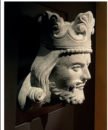
Steinhode av Magnus 6. Lagabøte Håkonsen