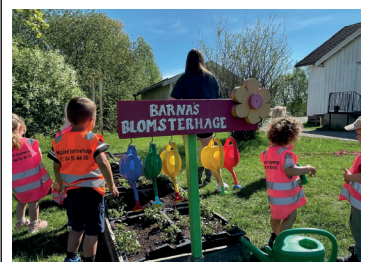
Barnas blomsterhage på Flateby