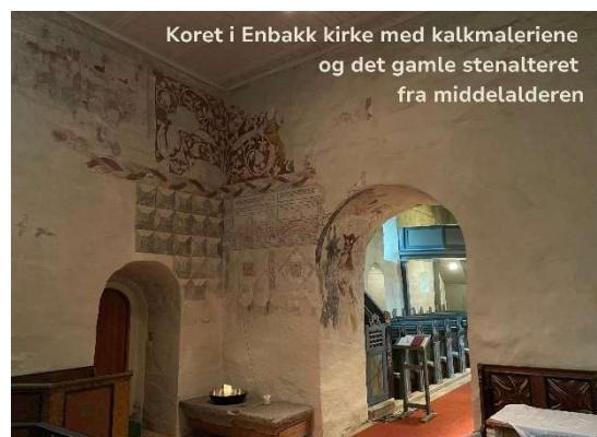
Koret i Enebakk kirke med kalkmaleriene og det gamle stenalteret fra middelalderen

Det gamle steinalteret fra middelalderen ble tatt ut av bruk i 1608 da kirken fikk nytt alter. Senere ble det brukt som gravstein og etter hvert som trappetrinn, men er nå plassert i koret i Enebakk kirke.