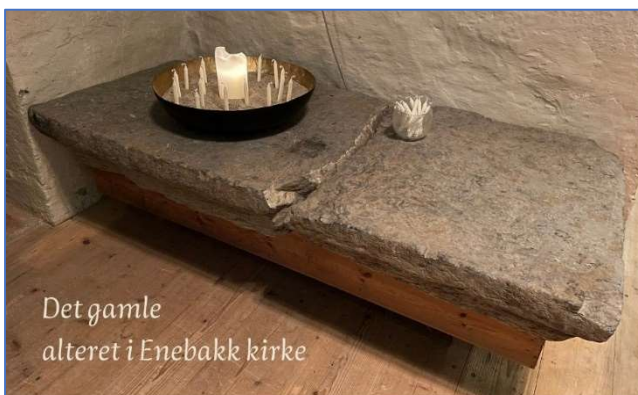
Det gamle alteret i Enebakk kirke