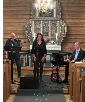
Trio Vi Tre.