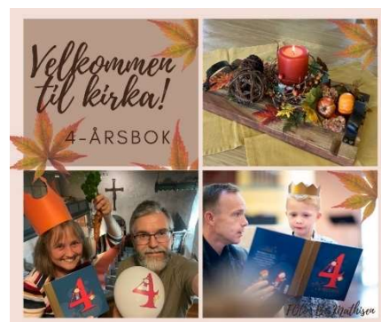
Fotomontasje laget av Hanne F. Weider.

Vi har hatt økt fokus på synlighet i nærmiljøet og markedsføring. Vi har blant annet hatt aktiviteter på byggedagen, ellevandring og julegrantenning. Vi har laget en felles brosjyre om arbeidet vårt og flyers om enkelttilbud. Vi har prøvd ut forskjellig markedsføring på sosiale medier, og ser allerede resultater av dette. Vi har jobbet frem en gjenkjennelig profil på våre trykte og digitale produkter. Vi har vært i kontakt med de andre aktørene som tilbyr kristent arbeid for barn og ungdom om samarbeid om aktiviteter og markedsføring av hverandres tilbud.