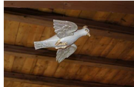
Duen er et symbol på Den Hellige Ånd. I Enebakk kirke henger duen over døpefonten.

Samlet sett er likevel erfaringene at kontakten med dåpsfamiliene er bedre, de er mer fornøyde og vi snakker mye om fortsettelsen i kirken med babysang og ulike tiltak i trosopplæring.