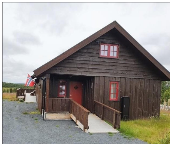
N. Lenningen seterhus