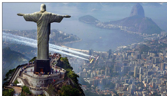
Kristus-statuen på Corcovado-fjellet i Rio de Janeiro, Brasil

Jesus-forteljingane står i dei fire evangeliebøkene i bibelen, Matteus, Markus, Lukas og Johannes. Det er trusstyrkande å lese og repetere dei.