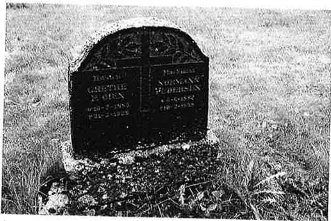
Gravminnet på grav nr. / / er definert som verneverdig.