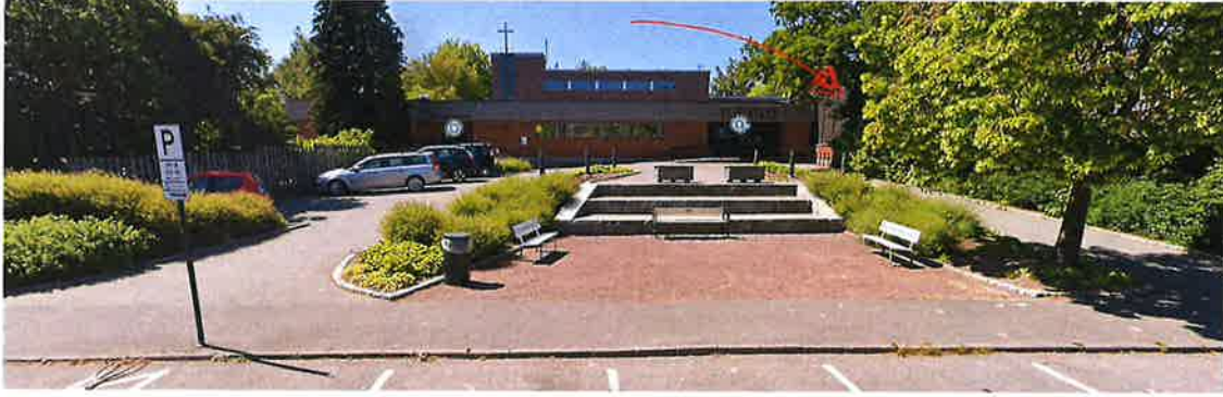
Hovedinngangspartiet (nr 1) til kirken avgrenses til Torvet 1 med høy vegg.