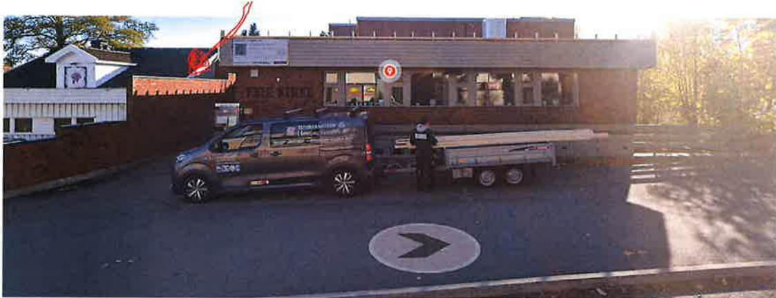
Kirkens sekundærادkomst (nr 2) fra nord går gjennom en smal passasje mellom murvegg (til venstre) og Teie kirke (høyre).