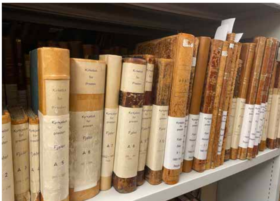
Bøkene vi hadde med er ikkje dei einaste frå Fjaler i arkivet, her er frå før mange andre som dekker tidsrom langt attende i tid.