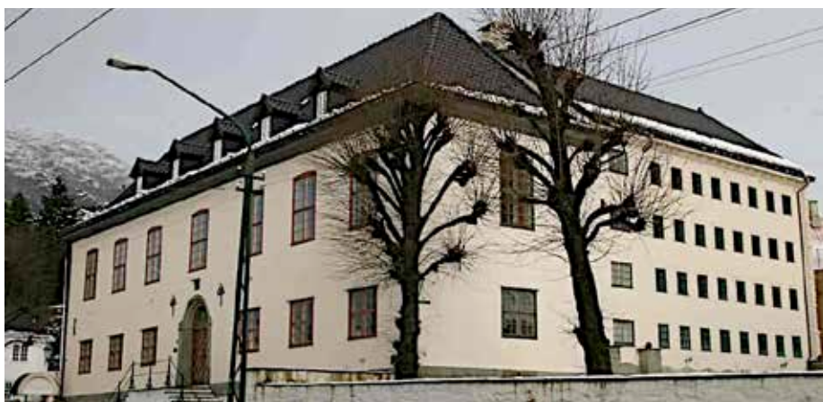
Statsarkivet i Årstadvegen 22 er frå 1921, ein stasleg bygning med mykje «godt stoff» innomhus

Statsarkivet i Bergen tek hand om eldre arkivmateriale frå statlege organ på