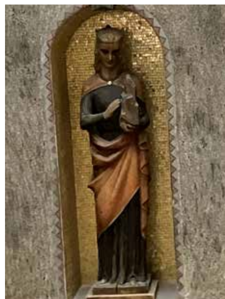
Arkitekten bak Statsarkivet i Årstadveien har også arbeidd med restaurering av Selje kloster, og i ein nisje i trappeoppgangen er denne St. Sunniva-statua plassert.