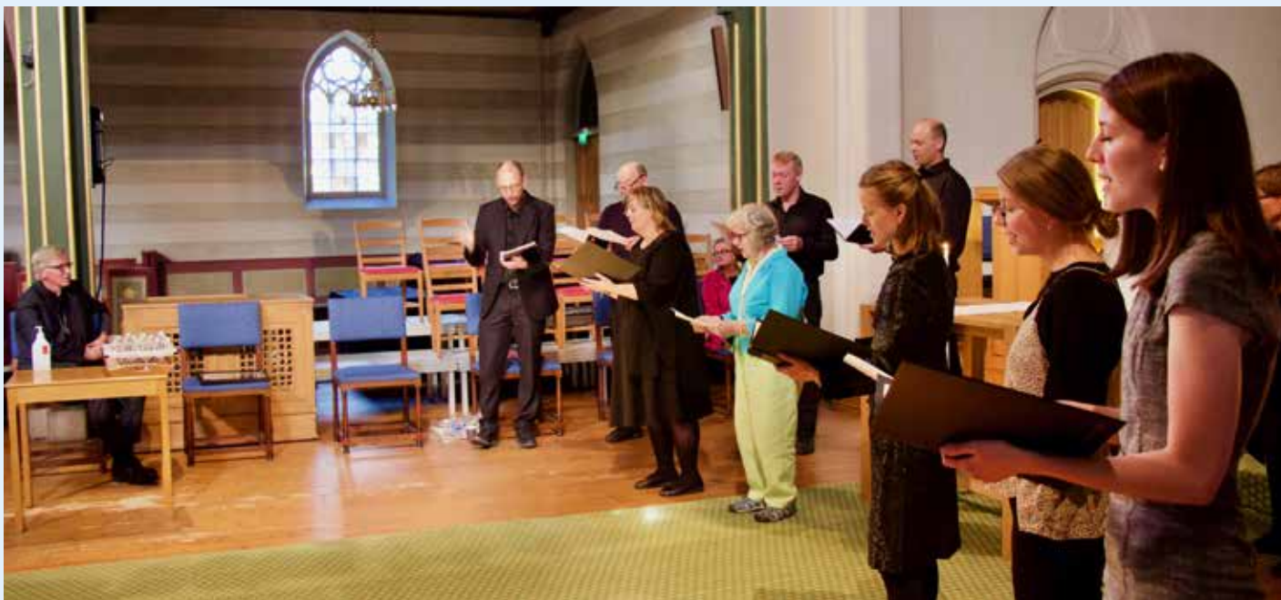
En korgruppe fra Domkirken fremførte vakre «An Irish Blessing» som sin hyllest og takk til en avholdt sokneprest.