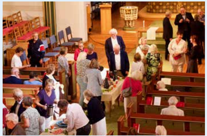
Korona-tider. Menighetsrådet hadde rigget til kirkecaffè i midtgangen i Domkirken etter avskjedsgudstjenesten.