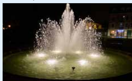
Belysningen gir magisk stemning i mørke høstkvelder