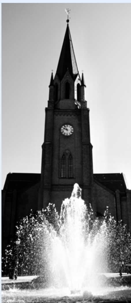
Kirketårn i sprudlende omgivelser.

Kommunen håper å sette hele området tilbake slik det så ut på 1880-tallet. Alle tekniske komponenter i fontenen, inkludert rør og sluk er demontert og byttet ut. Det er også støpt et nytt dekke i fontenen.