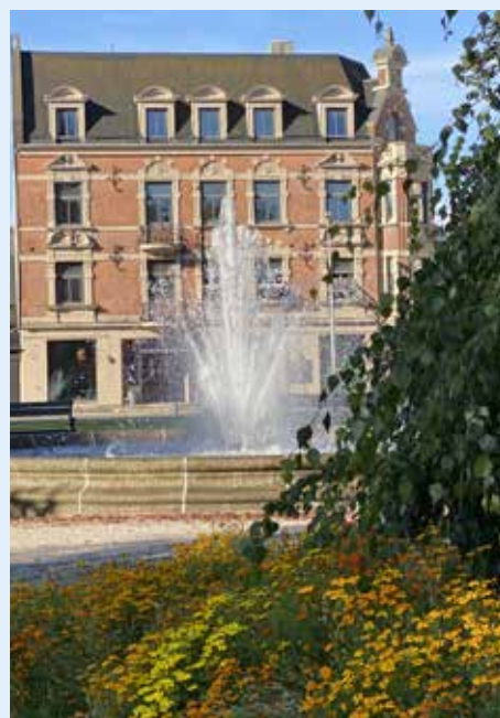
Blomster, fasade og vann i vakker kombinasjon.