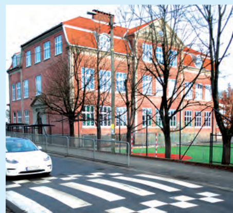
Trara skole og trafiksikkerhetstiltak opptar Trara Lokalsamfunn.