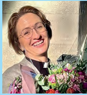
Møt vår nye biskop side 9-11