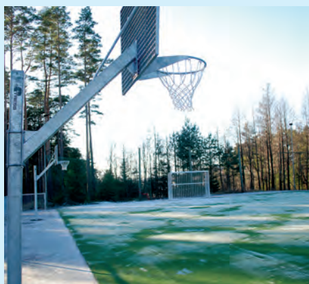
Ambjørnrød Lokalsamfunn har blant annet engasjert seg i det nye nærparkanlegget ved Kvernhuset.

Hvert år bevilger kommunen tilskudd til lokalsamfunnsutvalgene, og pengene fordeles videre til lokale frivillige initiativ, til lag og foreninger, samt tiltak i regi av lokalsamfunnsutvalget.