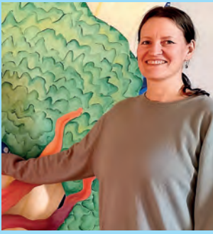
Livets tre i barnas kapell side 6