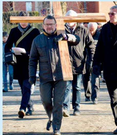
Langfredag ettermiddag er det felles-kristen korsvandring gjennom byen i regi av Fredrikstad kristne råd. Vandringen starter ved Den katolske kirken og beveger seg gjennom byen til Glemmen kirke.

vi til felles skjærtorsdagsgudstjeneste i Glemmen kirke i skumringstimen. Mens dagslyset svinner og nattens mørke tar over, samles vi om fortellingen om innstiftelsen av den aller første nattverden. Slik dette måltidet forbinde oss med troende over hele verden, og gjennom tidene, forbindes vi med hverandre. Deretter går vi sammen inn mot natt til langfredag, når lysene slukkes, alteret avdekkes, og det sorte gravferdskledet legges på. For de som ønsker etterfølges gudstjenesten av verket «Jobsuiten» av Egil Hovland, med Guttorm Guleng og Lars Tore Bø på orgel og lesning.