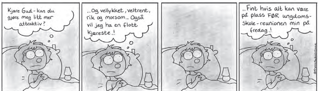
Tegnet av Marthe Lunde Kristoffersen-Fait.

Vi takker for samtalen. Har dere lyst til å bli bedre kjent med historiene til Marthe, kan dere lete opp @dropsint-hebucketcomic på Instagram.