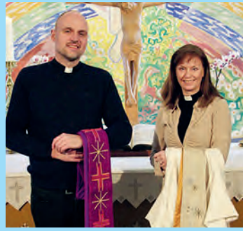
Opplev påsken i kirken side 12-15