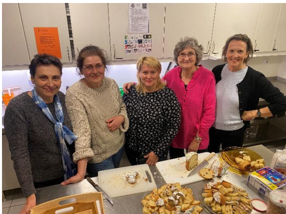
Gode hjelpere på Ukrainatreffet.

Seniorlunsj er fremdeles i sving og driftes av en god gruppe frivillige i menigheten, og det er hyggelig å se at både gamle kjente og nye dukker opp på de trivelige samlingene en torsdag i måneden.