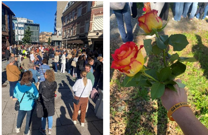
Verdensdag for selvmordsforebygging

Vi har i flere år deltatt i samarbeidet med andre trossamfunn som handler om selvmordsforebygging , via gruppen som heter Håp i mørket. Dette inkluderer også samarbeid gjennom organisasjonen Leve (Landsforeningen for etterlatte etter selvmord) og den nye organisasjonen Gå for å leve. Verdensdagen for selvmordsforebygging ble markert som i fjor med et rosetog fra sentrum og over til Isegran, hvor det ble holdt appeller og rosenedleggelse på vannet. Flere hundre ungdommer var med på vandringen.