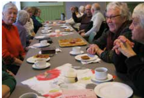
Kos med vaffel og kaffe

I samarbeide med Folkets Hus ble det åpnet café 17. mars 2003. Cafeen er åpen hver annen mandag i partallsuker og er åpen for alle. Dette har blitt et samlingssted. Cafeen er åpen kl. 12 – 14 og hver gang møtes omkring 30 personer. Man kan kjøpe vaffer, kaffe og det er loddsalg. Inntekten av salget går bl.a. til å betale husleie, gevinster mm.