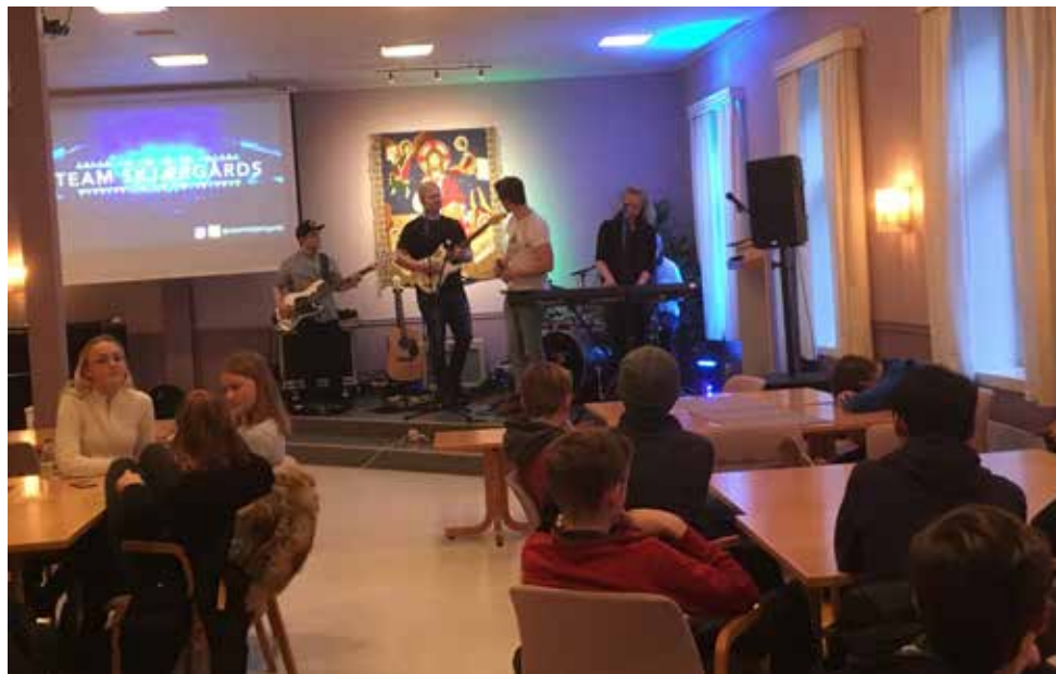
Ungdommer fra musikkfolkehøgskolen Viken på Gjøvik hadde konsert og undervisning på Betania i Gamlebyen

Etter nytt år har noe av fokuset vært hvordan vi kan være med på å gjøre en forskjell. Derfor var konfirmentene på besøk på Torsnes sykehjem for å spille bowling og bingo med beboerne. Konfirmantundervisningen i forkant var en av sykepleierne ved sykehjemmet på besøk og fortalte om hvordan en best mulig kan møte mennesker som er rammet av demenssykdom.