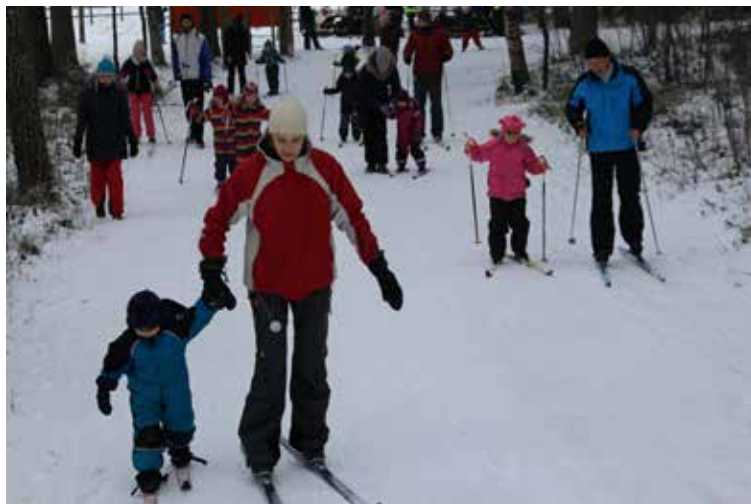
Hele menigheten på skitur.

Det er en stor forandring fra en kommune som uttrykte stor skepsis overfor menigheten for noen få år siden.