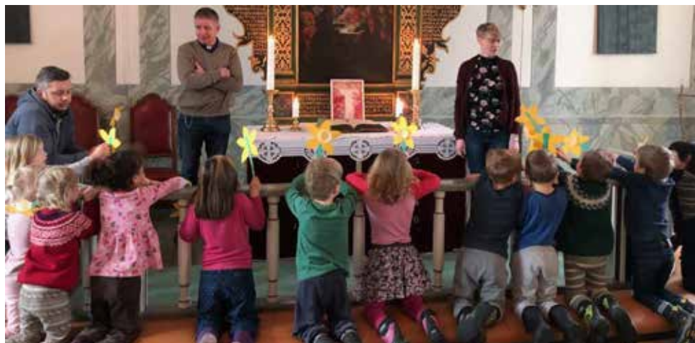
Påskevandring med velstoppen barnehage.

Det var fint å vandre og sanse sammen med barna, og vi er glade for det fine samarbeidet mellom kirken og skolen/ barnehagene i Torsnes.