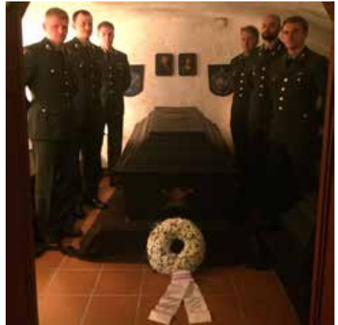
Fra besøket 2017

På bakgrunn av dette valgte vi nettopp ham, fordi han viste mot, initiativ, list og handlekraft som leder – karakteristikkene enhver militær offiser kan nyte godt av.