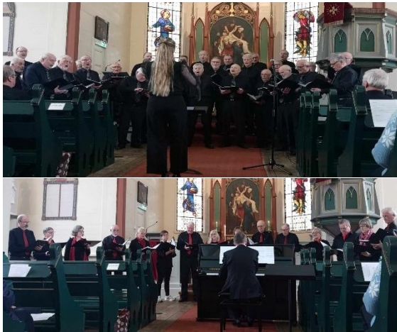
Konsert i Strandvik kyrkje med «Os Mannskor» og «Sine Nomine».