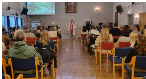
Familiemix på Eikelandsosen bedehus.

Ein del lekmannsgudstenester vart haldne av kyrkjelydspedagogen dei skulerte frivillige medarbeidarane, både gudstenesteleiing og forkynning. Tendensen som syner at gudstenestene på Eikelandsosen bedehus er dei best besøkte gudstenestene ser ut til å halda fram i 2024.