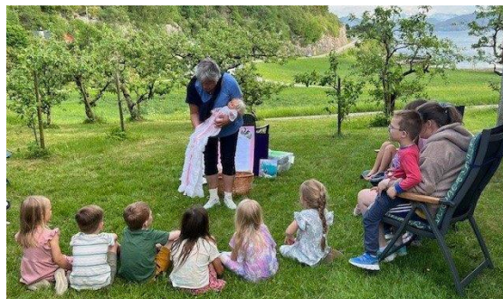
Dåpsskule i Djuvik

Av kontinuerlige tilbod i 2024 kan nemnast: KLUBBEN for tweens 5.-8.klasse har blitt ein god samlingsplass med bra oppmøte og jamt trøkk. Ein ser her at dette tiltaket også treff ungdommar i trinna over det tiltenkte aldersspennet. Eit viktig tiltak som har blitt jobba godt med av tilsette og frivillige.