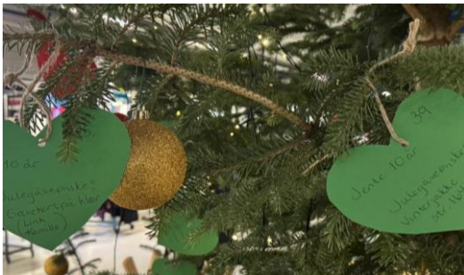
Frå «julegåvetreet» på Fjord'n Nærsenter, ein del av matgåve-aksjonen.

Meir enn 60 matposar med julemat vart delte ut til personar og familiar som hadde meldt behov. Behovet var rekordstort i 2024, og utan store pengegåver frå næringslivet hadde me ikkje klart aksjonen. Me ser at behovet aukar meir enn gåvene/tilgangen på pengar.