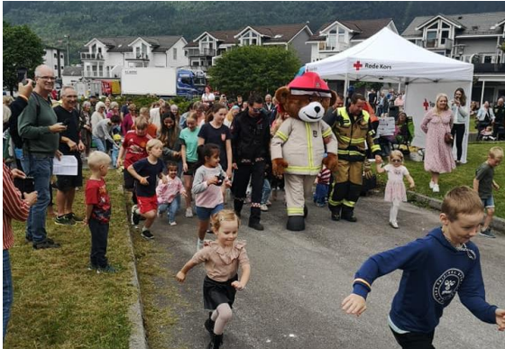
Fellesstarten går på Walk & Run

Aksjonen fekk inn om lag 400 000,- kr. Det er stort engasjement for dette føremålet, m.a. blant gjengen i Bruktbuo. Til saman har Fusa sokn og Bruktbuo bidrege med meir enn 500 000,- til CBWCF i 2024.