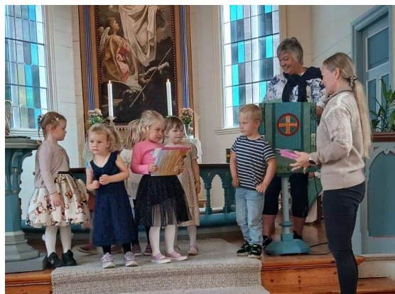
Utdeling av bibelbok til 4-åringar i Hålandsdalen

NOAH , friluftsklubben for gitar 5.-8. klasse, har i mange år hatt flinke og dedikerte leiarar og bra oppmøte av deltakarar. Eit strålende tiltak som har betydd mykje for ein heil del gitar i mange år. I 2024 har framgangen frå 2023 halde fram og tal deltakarar har auka jamt. Ein flott gjeng ungar/ungdomar og flinke vaksne møtest jamnleg til mange spanande aktivitetar.