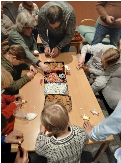
Full konsentrasjon med pepperkakepynting på kyrkjelydsweekend

Etter 15 år var kyrkjelydsweekend endeleg på programmet igjen i 2024. Leiren samla om lag 55 deltakar i alle aldrar og vart halden i Sætervika. Ein slik weekend er viktig for fellesskapet i kyrkjelyden og det er ynskjeleg at dette står jamnleg på planen i åra som kjem.