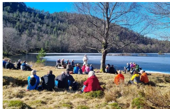
Frifuftsgudsteneste ved Hafskorsvatnet

Ser me på tala for dei siste seks åra er totalt tal deltakarar på gudstenester 21% lågare i 2024 enn i 2019, men mest markant nedgang er det i Strandvik og Sævareid med høvesvis 53% og 35% nedgang.