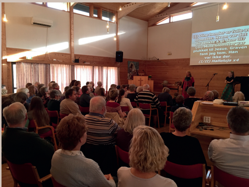
BBL-kveld i april 2018.