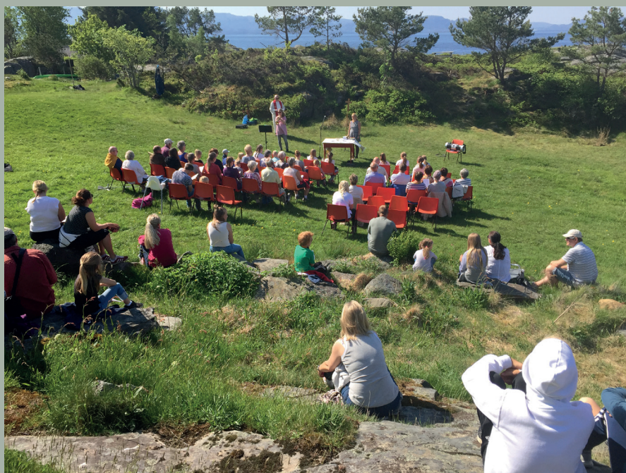
Friluftsgudsteneste på Vinnesholmen i 2018.

2. pinsedag Vinnesholmen 10. juni kl.12.00