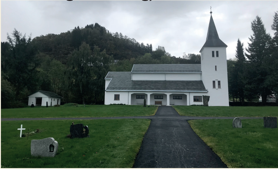
Fusa kyrkje fekk Altaskifer i 2018. Alle kyrkjene våre har no skiftertak.

I 2018 fekk vi utført fleire store oppgaver. Særleg vart det nytta mykje ressursar til å skifte det gamle taket på Fusa kyrkje til altaskifer. Både reiskapshus og bårhus fekk nytt skiftetak, kyrkja og dei to andre bygga vart mala og det kom to nye overbygg på plass på kyrkja. I Sundvor kyrkje fekk vi ei omfattande og flott innvendig opprusting av kyrkja, og i Strandvik kyrkje fekk vi mala ein del område innvendig som vi ikkje hadde midlar til då kyrkja vart rusta opp for nokre år sidan.