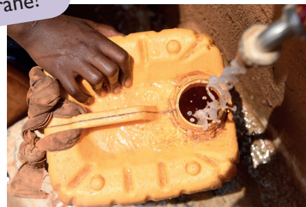
Reint vatn i flyktningeleiren Jilab i Somalia.