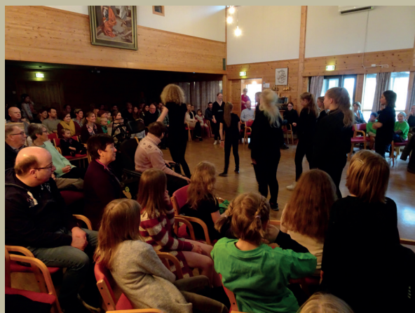
Barnas påskefest i 2018.