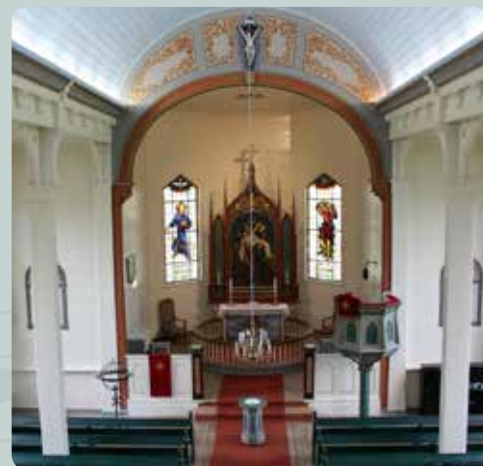
Strandvøik kyrkje.