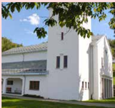
Fusa kyrkje.