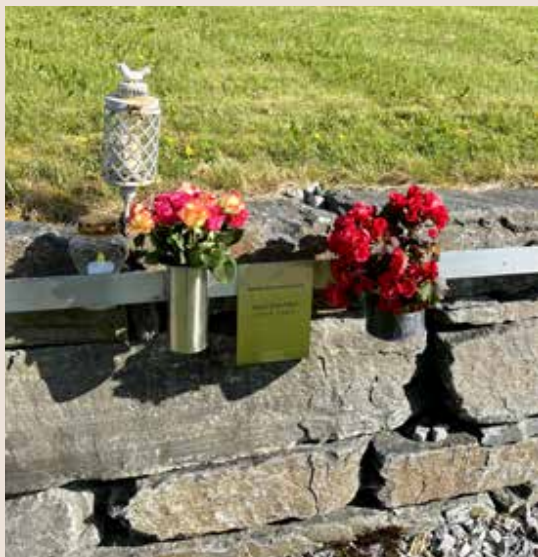
Foto: Urnefelt på Fusa gravplass vest.

Det kan setjast ned inntil 4 urner i ein vanleg urnegrav.