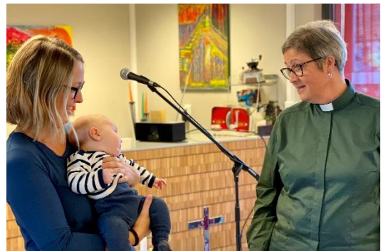
Hverdagsmesse med innslag fra babysang på sykehjemmet