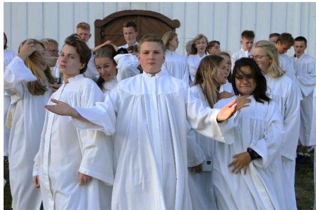
Årets konfirmanter i vind og vær.

Dette året hadde vi 50 konfirmanter fordelt på 11 på vår og 38 på sommer/høst, samt én konfirmant med eget, tilrettelagt opplegg i kirken. Vårkonfirmantene hadde de fleste samlingene med kateketen, og selve konfirmasjonsdagen ble utsatt til andre helg i september. Sommerleiren ble avholdt med strengt smittevern. Vi hadde ni konfirmasjonsgudstjenester og to konfirmasjonsgudstjenester med én konfirmant.