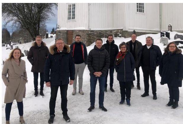
Fra overrekkelsen av gave fra pinsemenigheter på Romerike og fra Oslo kristne senter.

Og til slutt takk til ansatte, vikarer, frivillige medarbeidere, foreninger og andre samarbeidspartnere for innsats og samarbeid i året som er gått.