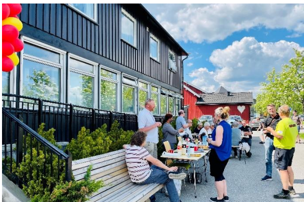
Åpning av det nye kirkekontoret, og startskuddet for «fredagsvaffel».

Musikkcafeen har vært et flott tiltak gjennom mange år, men har dessverre ikke kunnet ha noen aktivitet i 2021.