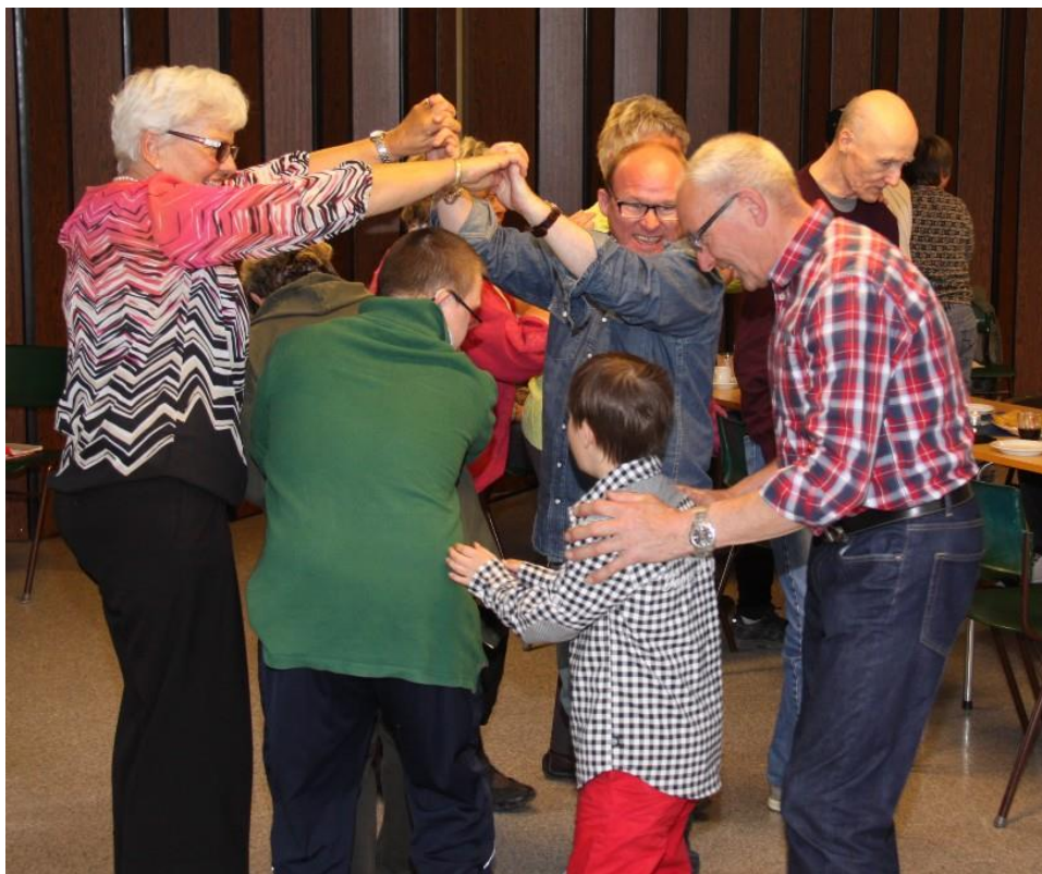
FULL AKTIVITET PÅ MUSIKKCAFÉEN. ER DET "BRO, BRO, BRILLE"?

Vi takker alle fra boligene som trofast kommer på besøk 1. mandag i måneden. Vi er glade for å se dere alle sammen. Det er en stor glede å få være med i Musikk-cafeen, og det er et viktig ledd i det diakonale menighetsarbeidet.