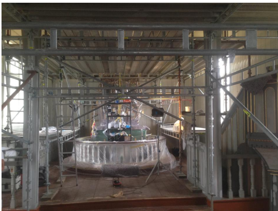
OMFATTENDE ARBEIDER HAR BLITT UTFØRT I HENI KIRKE

Når en listeført kirke skal males kreves det en del forarbeid. Riksantikvar skal uttale seg og biskopen skal godkjenne fargevalget. Det viste seg etter en lengre prosess, at de eksisterende fargene inne i kirken samsvarte med de opprinnelige fargene med unntak av fargen i koret. Der var det et tidligere vedtak fra riksantikvar om endring på grunn av fargene i altertavlen. I august ble malerarbeidene startet opp. Alliero AS var entreprenør. Alle overflater ble malt, med unntak av altertavle og deler av prekestolen. På jubileumsgudstjenesten den 12. oktober, sto kirken ferdig nymalt. Takk til Alliero for godt utført arbeid.