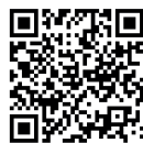
Qr kode Himmel på jord

Himmel på jord En nåde så stor Jeg ække aleine her jeg bor.