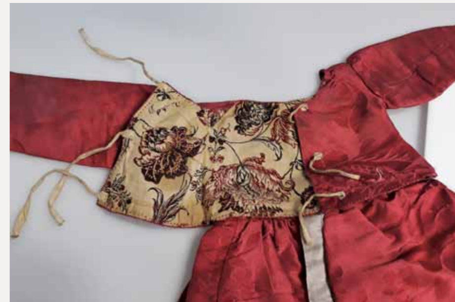
Dåpskjolen fra Hunn har nydelige detaljer.