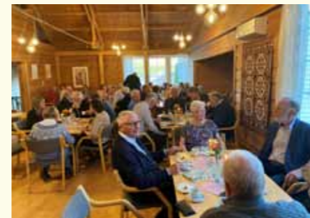
Det var god stemning på Vardal menighetshus under frivillighetsfesten.