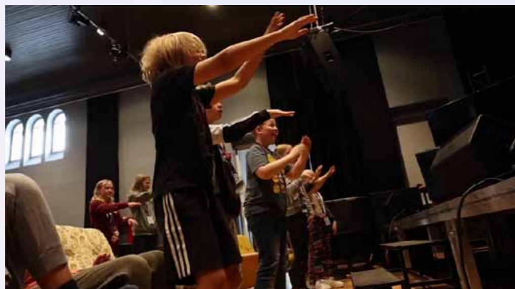
Fra supertorsdag på Byscena.

Byscena Bedehuset blir i nær fremtid registrert som et eget foretak. Også i fremtiden ønsker vi på Viken at Byscena Bedehuset skal være et hus fylt av ulike aktiviteter, musikk, kreativitet og tilhørighet. Kjelleren (Hula) og den gamle Lillesalen vært igjennom et solid hamskifte, og skal i fremtiden driftes som et studiokollektiv for 3 av byens musikkprodusenter. Her vil både lokale og nasjonale artister kunne gjøre profesjonelle innspillinger i