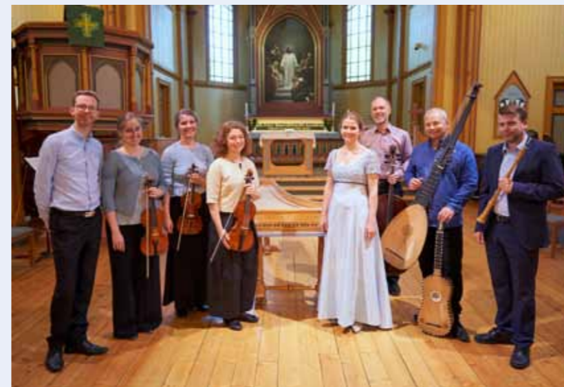
Nivalis Barokk i Gjøvik kirke i 2021.

I vår kirke døyper vi med vann og Ånd. I innledningen påkaller vi Ånden å komme slik at vannet blir et hellig vann. Så døyper vi i Faderens, Sønnens og Den hellige ånds navn. Tre håndfuller navn øser vi ut over dåpskandidatens hode. Det er sterkt å få være med på, å døpe et menneske. Og for min egen del er det sterkt for meg å vite at jeg selv er døpt. Jeg fikk møte Gud i min egen dåp og jeg vet at han er med meg resten av mitt liv.