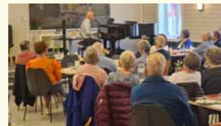
Hunn menighet hadde sin frivilligfest 12.mai med middag fra Gutta i dampen, foredrag og musikk og et festlig pyntet bord i menighets-salen.