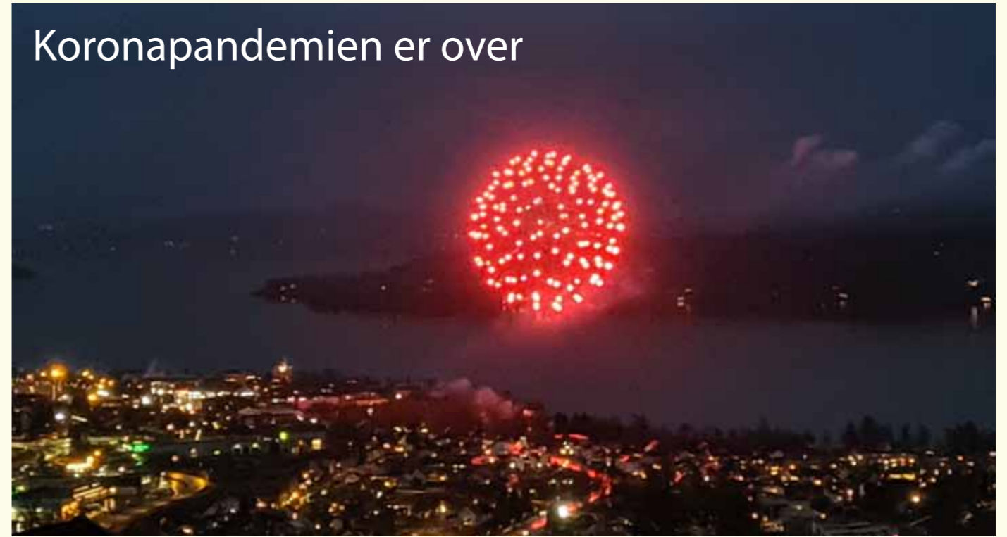
Er det en tilfeldighet at fyrverkeriet i Gjøvik 17.mai (her fra 2021) ser ut som koronavirus over byen? Kirkelig virksomhet har også vært underlagt strenge koronarestriksjoner, men nå ser det heldigvis ut til å være over.