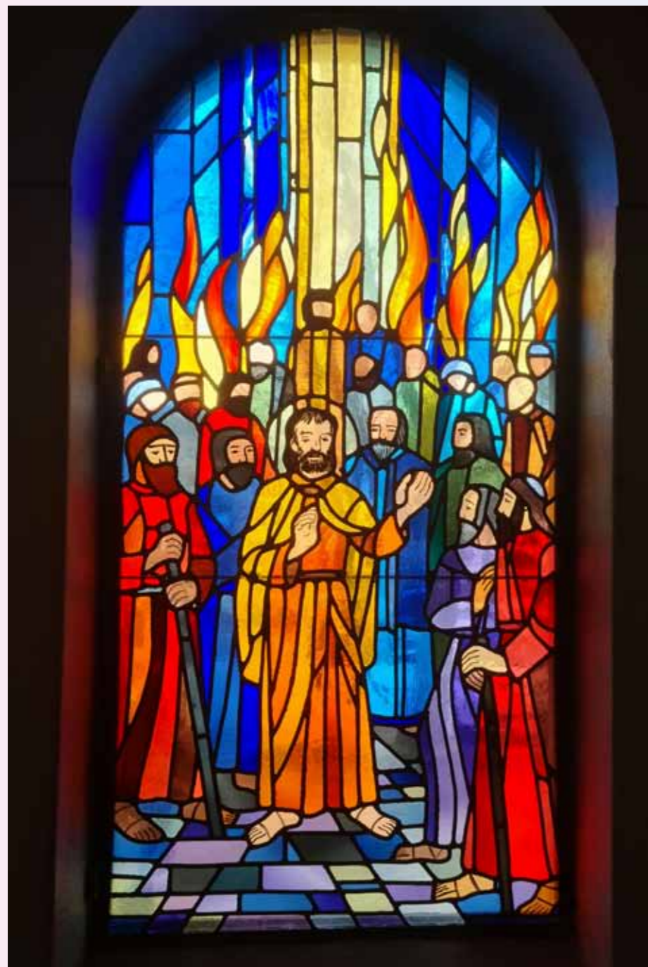
Glassmaleri fra Sandefjord kirke med pinsesmotiv av Terje Grøstad.