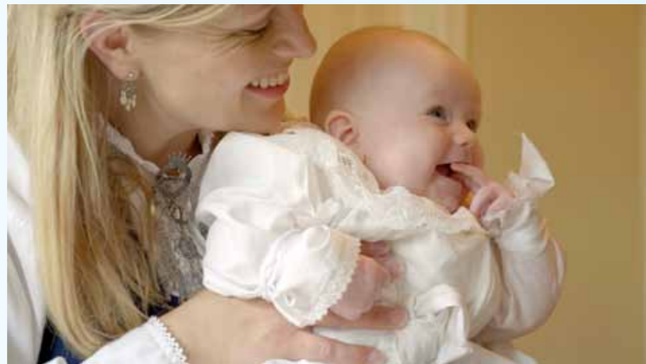
Dåpen gir trygghet og håp. Illustrasjonsfoto av Kristian Sandmark.

Dåpen er en gave der det uttrykkelig sies at Gud tar imot oss.