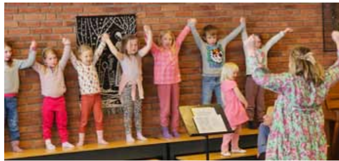
Her er noen av barna som synger i Hunn barnegospel.

Hunn barnegospel har øvelse mellom kl 17.30 og 18.30. Dette er for barn i skolealder. Her går det i fengende sanger. Barna lærer tekster og synger. I pausen er det saft