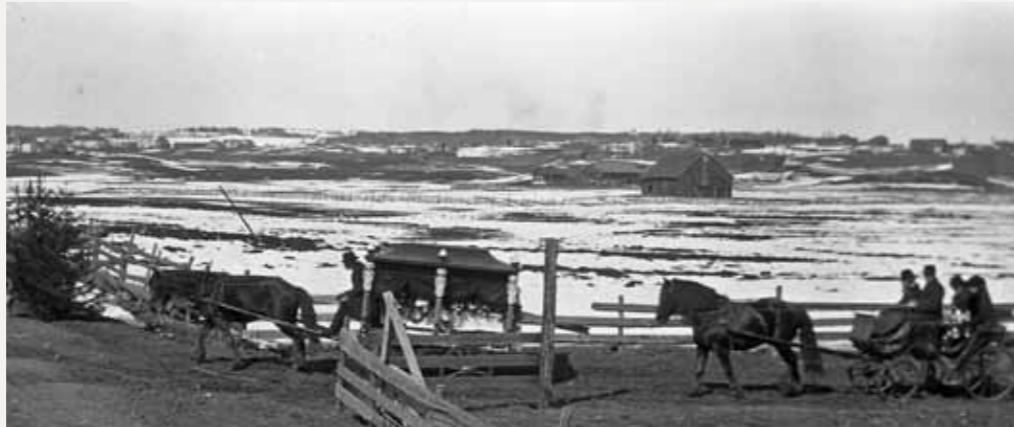
Fra et gravfølge på Kraby på Østre Toten.

Det er bygdekvinnelaget i Vardal, Biri og Snerthingdal, Gjøvik historielag, Mjøsmuseet og Den norske kirke som inviterer. Temaet «gravferd» vil bli belyst med musikalske, kulturelle og historiske innslag. Det blir interessante fortellinger om