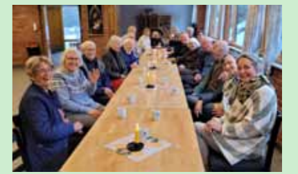
Fra kirkekafe i Hunn 23.4.23.