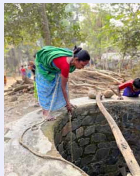
Vannet hentes i fra brønnen.

Apropos å ønske «nye» velkommen. Den ene dagen av årets tur var satt av til å besøke en «Santal Village» - disse finnes det mange av og vi besøkte den lokale landsbygden til en av våre venner. Da busen vår ankommer ser vi hele landsbygda stående på rekke og rad for å ta oss imot. I det vi går ut av bussen er de i gang med sang og dans for å ønske oss velkommen. I tillegg vasker de føttene våre, en gest som fortsatt er svært vanlig praksis i Dumka. Vi snakker ikke samme språk, jeg har lært