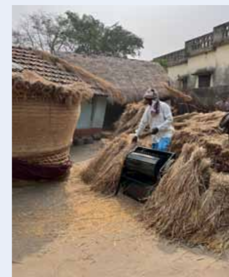
Maten høstes inn fra markene hver dag. Her foregår tresking.