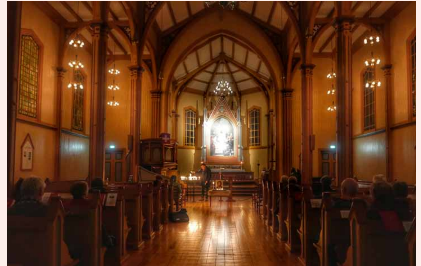
Gjøvik kirke har vært åpen mandag til fredag i fastetiden fram til avlysningen midt i mars.

- Kjære Gud, - Gi oss en sterk tro og en god porsjon selvdisciplin. Se til alle som er redde. Vær hos de syke. Hjelp oss alle i disse coronatider. Amen.