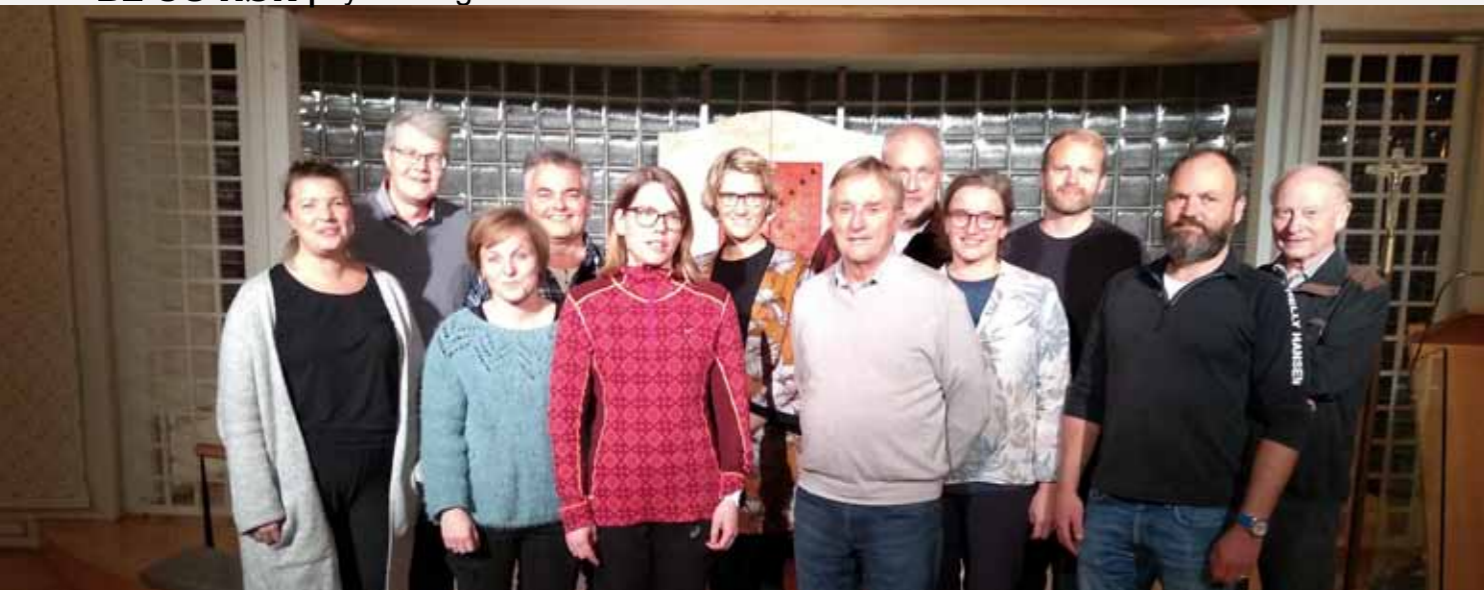
Engehaugen menighetsråd 2019-2023 samlet til sitt konstituerende møte.