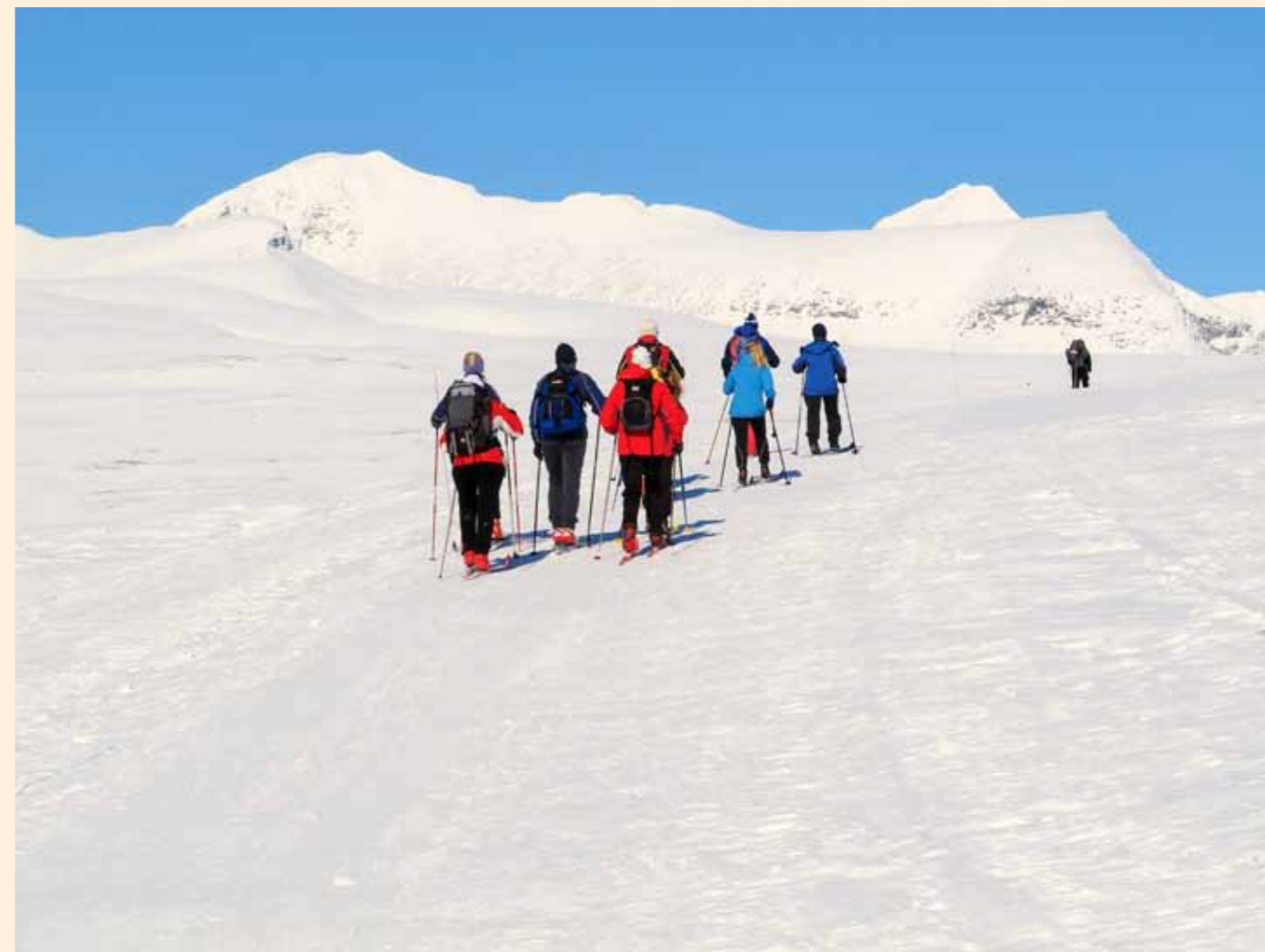
Drømmepåske i fjellet, her fra Rondane.

Dine lepper er fulle av sanger. Hvorfor denne glede, hvor kom den fra? Fra den grav der hans legeme hvilte - Han stod opp, og verden ble fylt med sang. Halleluja, halleluja, Halleluja, halleluja.