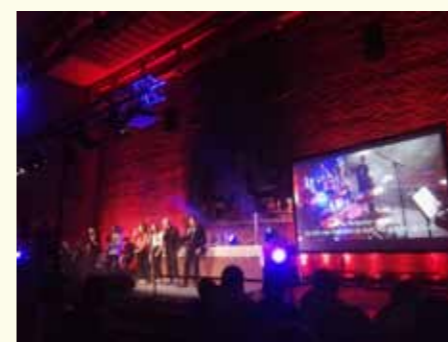
Kick-off for konfirmantene i Hunn kirke 31.januar.

I år skal man altså ikke forvente at noen kommer med fastebøsse banker på døra og ber om et bidrag. Hver og en av oss må ta ansvaret selv for å bruke VIPPS 2426 og gi. Nøden tar ikke pause. La det ikke bli med tanken. VIPPS NÅ!