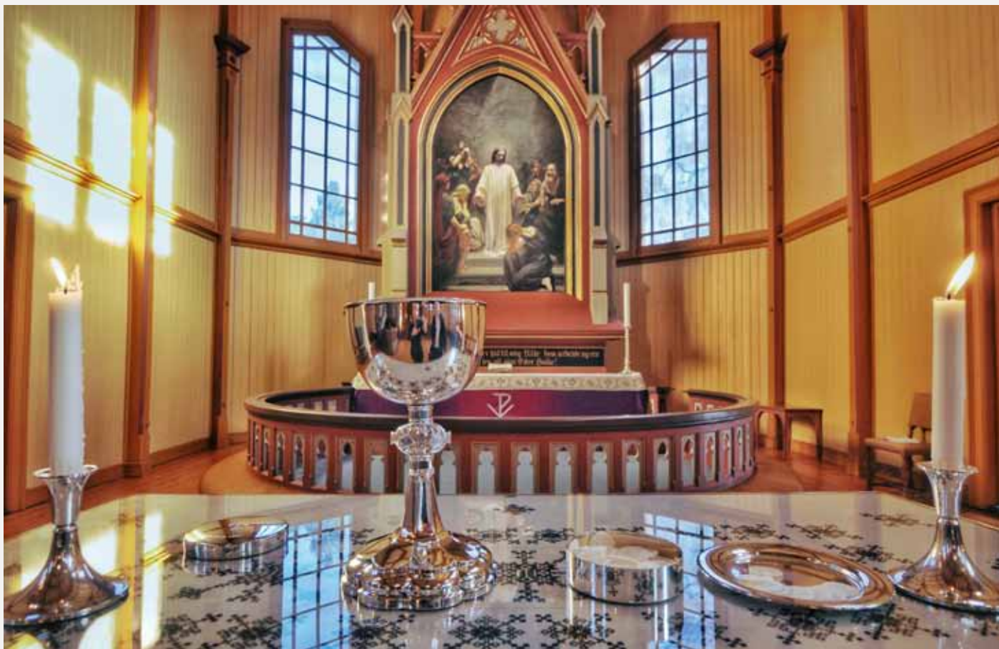
Gjør dette til minne om meg... Her er nattverdbordet dekket.