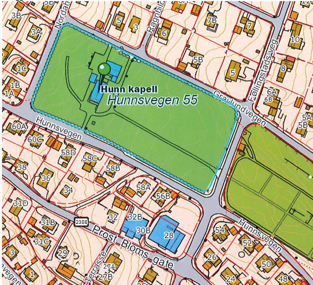
Illustrasjon 1: Kartutklipp som viser beliggenheten i Norbyen.