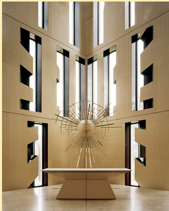
Våler nye kirke.

Da Maria Magdalena og den andre Maria kom til graven var det fremdeles mørkt. Sorgen var bunnløs. Fraværet uendelig. Døden så endelig. Alt dette kan vi begripe. Og tomheten var ikke bare en indre følelse – også graven var tom. Jesu kropp var borte.