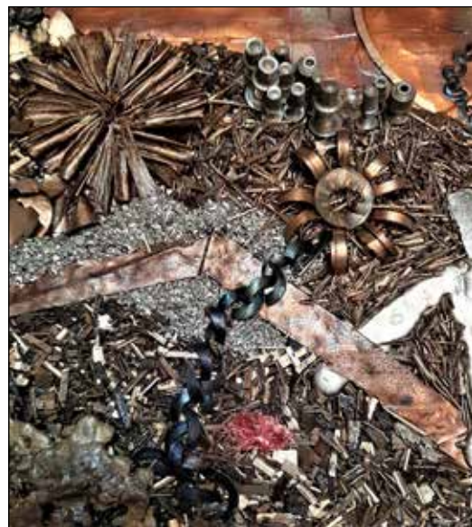
Utsnitt av kunstverket.