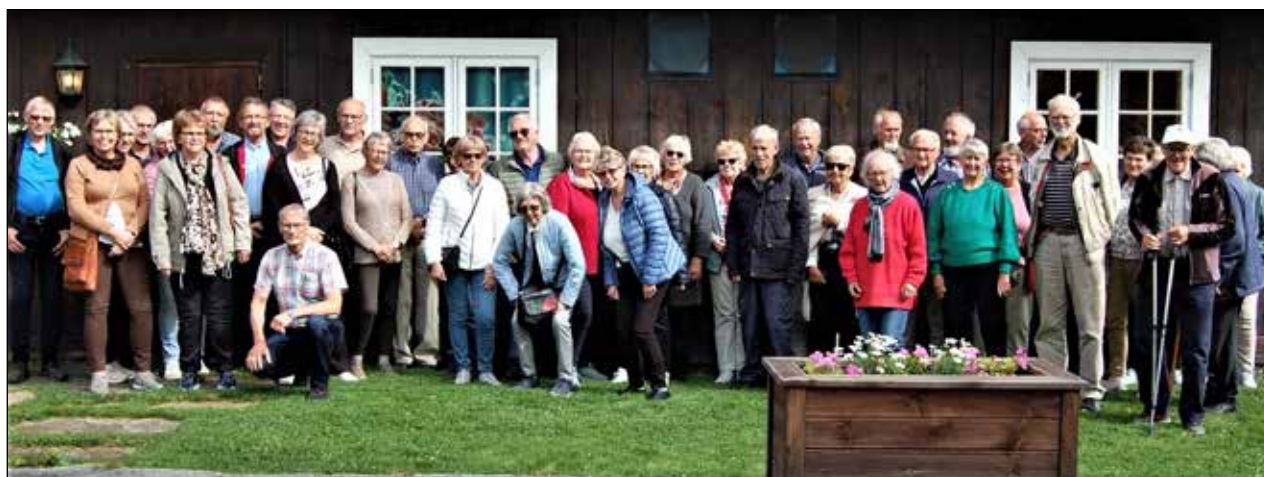
Deltakerene på turen samlet utenfor Heidal ysteri