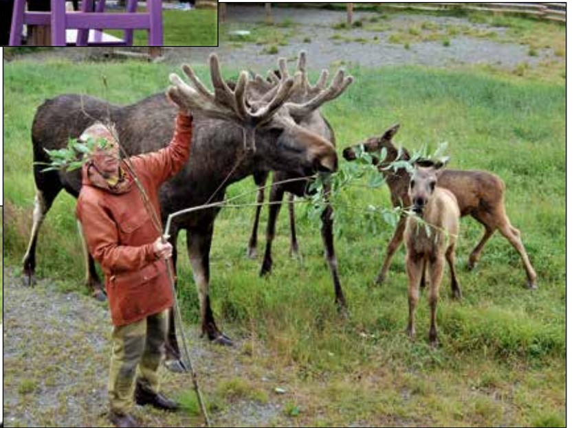
Elgfamilien blir matet med ferke seljektivister her dag i sommerhalvåret