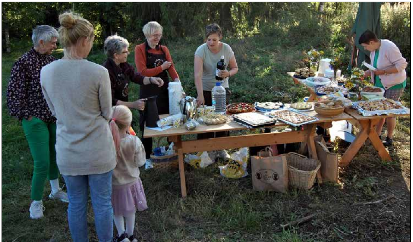
Bygdekvinnelaget serverte kirkekaffe