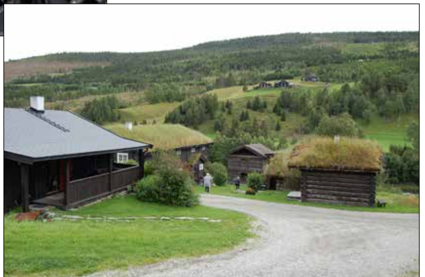
Vi spiste lunsj på Nordre Ekre gardshotell