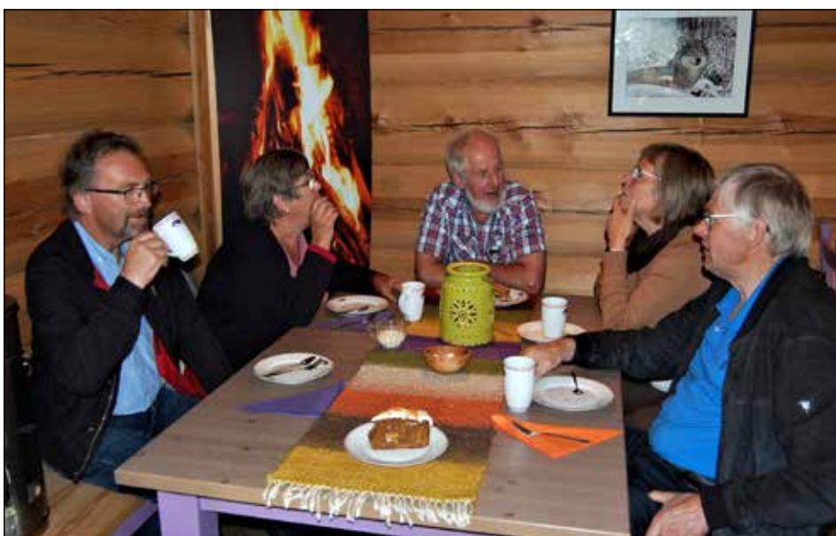
På Glittersjø fikk vi servert kaffe og gulrotkake