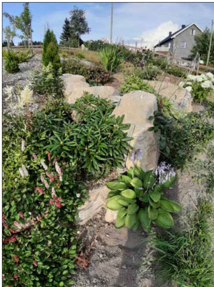
Hårtensia blandt lunende steiner