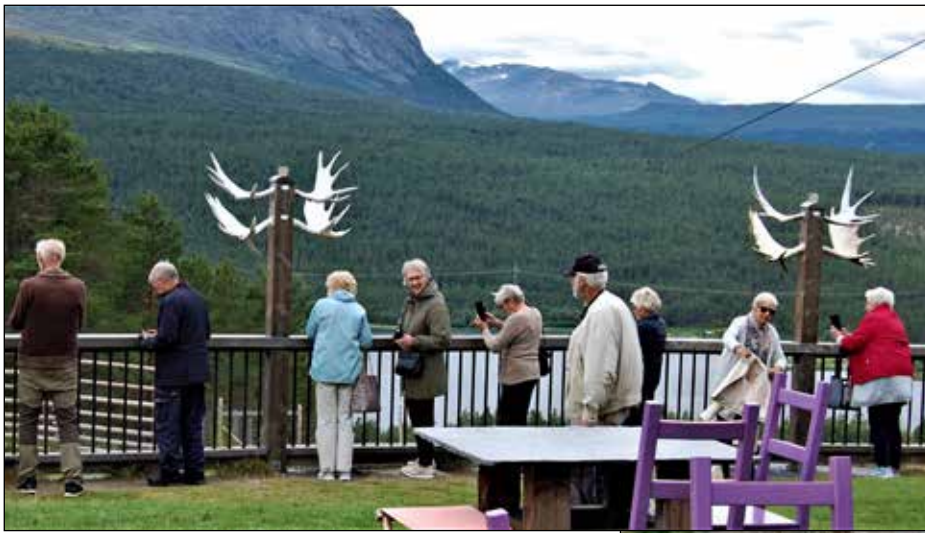
Glittertind sees i det fjerne