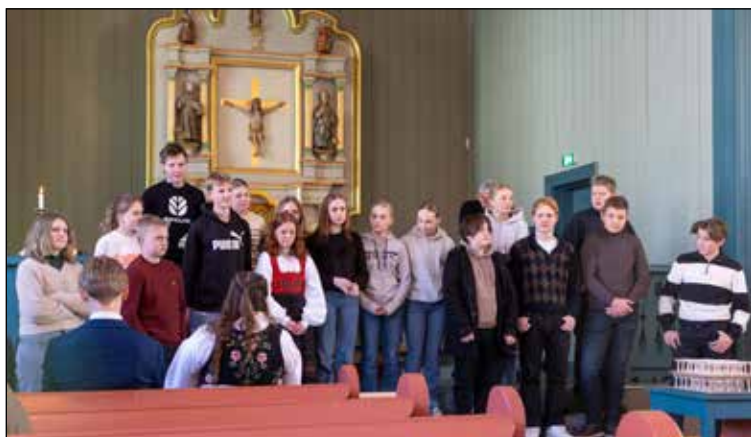
Årets konfirmanter ble presentert i Nykirke søndag 22. januar.

Konfirmantopplegget veksler mellom fellessamlinger med alle Gjøvik-konfirmantene og lokale samlinger og gudstjenester i Snertingdal. Gjennom konfirmasjonstida håper og ber vi om at konfirmantene skal få et mer bevisst forhold til kirka og kristen tro.