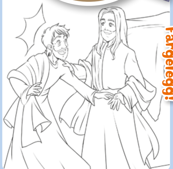
Tegning: Chiara Bertelli