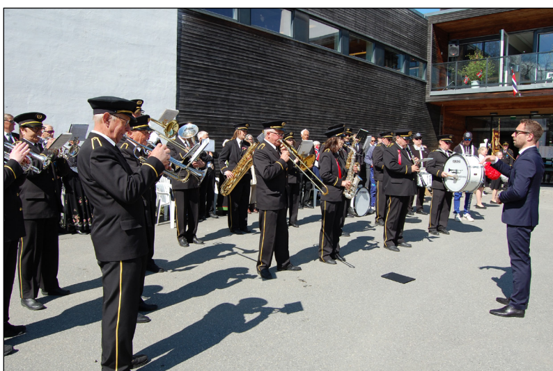
17. mai er de alltid på plass fra tidlig morgen til langt ut på ettermiddagen