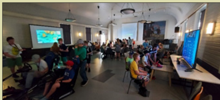
Fra gaming gruppa på Superuka i 2022