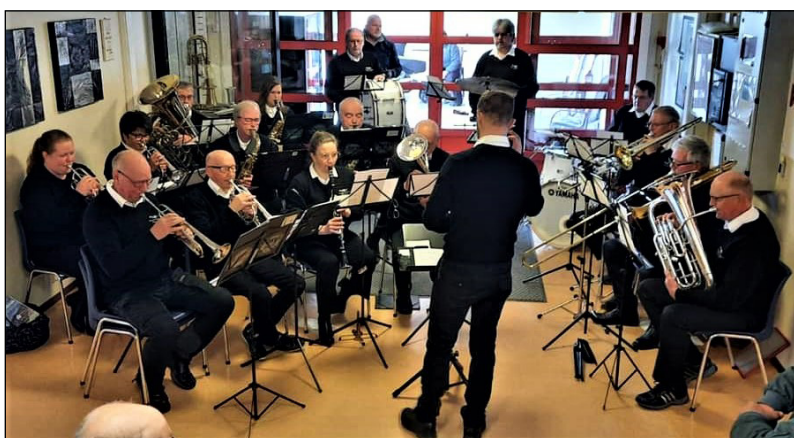
De svikter ikke omsorgssentret 1. mai. I år ble det konsert innendørs