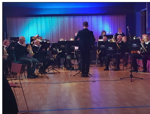
I mars arrangerte de marsjkonert på skolen med fokus på norske og utenlandske marsjer