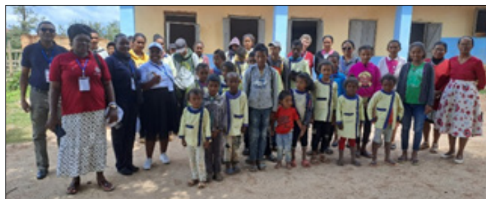
På besøk i en lokal menighet som har praktisert UYT i flere år. Skolebarna sammen med deltakere fra konferansen og menighetens kvinneforening.

Fra høsten håper vi å få med enda flere barnehager og institusjoner på eventyret vårt her hjemme på Gjøvik.