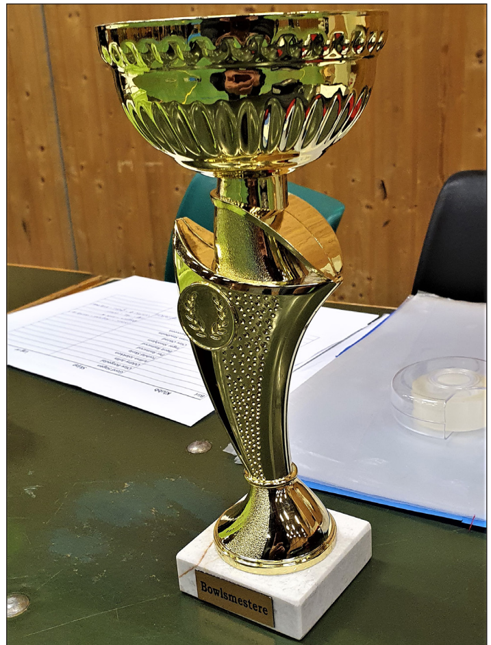
Biringene tok med seg første andel i vandrepokalen

Etter pausa ble det spilt flere finaler og et lag fra Biri vant og tok første andel i vandrepokalen.