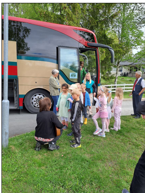
Ved Engehaugen kirke møtte barnehagebarna oss med sang