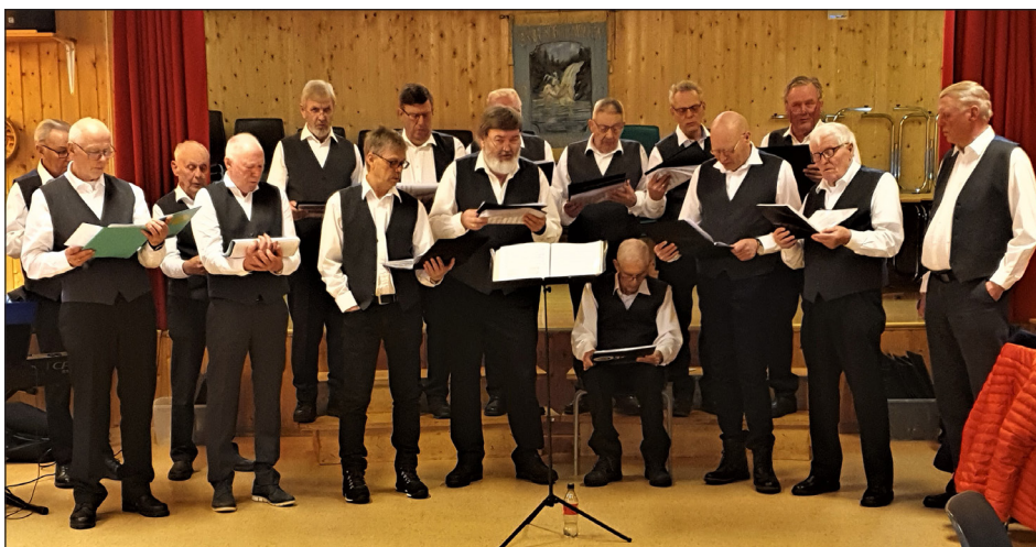
Grande mannskor deltok med flott sang.

Standardene fungerer også som et rettighetsdokument for medlemmer og som en etisk veiledning for medarbeidere, ledelse og styre. Standardene vektlegger at et fontenehus er