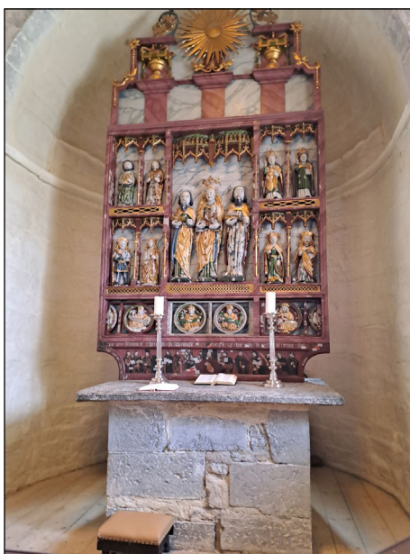
Altertavlen i Balke kirke Maria-tavle