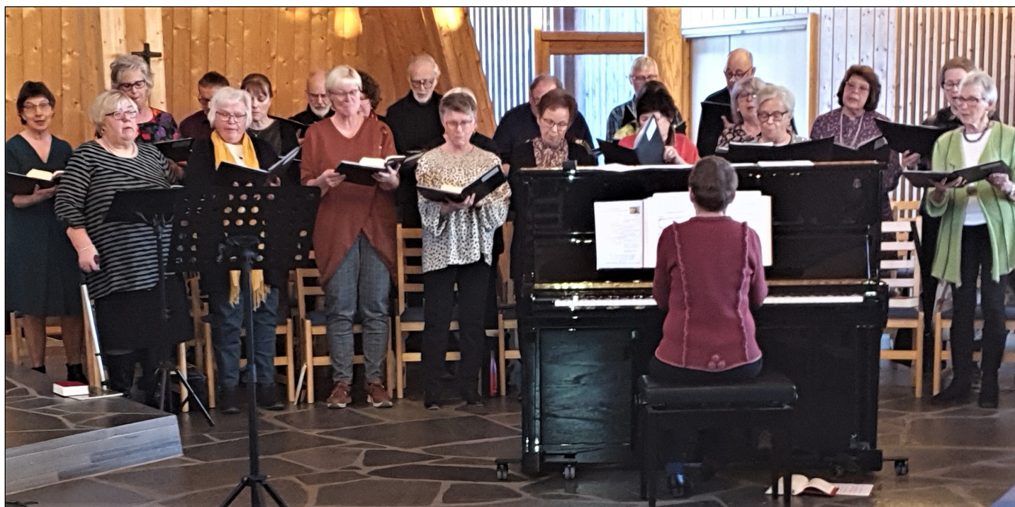
Søndag 26. mars var det påskesangkveld med Biri Snertingdal kantori