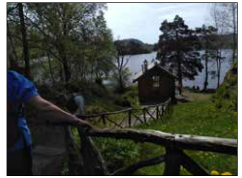
Komponisthytta, Nordåsvannet i bakgrunnen

Kirken har tre portaler utenom vestportalen (mellom tårnene), hver av dem eksempel på ulike faser i portalkitekturen i middelalderen. Mest vanlig i middelalderen var tretrinns portaler inn mot døren, som finnes i den nordre muren. Koret er smykket med 15 legemsstore apostelfigurer, laget på en måte som får fram den enkeltes personlighet. På gulvet ligger gravsteiner over tyske skippere, kjøpmenn og prester fra 1500 – 1700-tallet. Svært mange av maleriene i kirken er minnetavler over personer med tilknytning til kirken (epitafier). Dagens orgel er tysk og ble bygget i 2014-2015 og innviet ved gjenåpningen av Mariakirken 21.juni 2015. Det er en nydelig akustikk for sang i kirken, og kantoriet stilte opp i koret og sang «Agnus Dei» og «Livets lys». Det ble litt oppmerksomhet fra noen av tu-