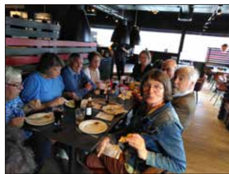
Peppes pizza, Geilo

Ute ventet kirkekaffe i regi av menigheten i Birkeland. Tur-komiteen hadde i tillegg gjort avtale med dem slik at vi fikk disponere kjøkkenet i kirkestue/bedehuset til å smøre oss mat og spise før hjemturen tok til. Det ble en hyggelig samling før avreise. Reisen hjem fulgte E16 mot Dale og Voss, der vi tok av E16 og fortsatte Rv13 mot Granvin og Hardangerbrua, Norges 6.lengste bru på 1380 meter. Derfra ble det Rv7 mot Eidfjord, Måbødalen og dernest Hardangervidda. Veien opp Måbødalen er nå lagt i 4 tuneller, den lengste på 1900 meter. Deler av gamleveien er gjort tilgjengelig som kultur- og veihistorisk museum, der flere gamle veier kan oppleves. Øverst i Måbødalen ble det en stopp ved den 182 meter høye Vøringsfossen, med tilnærmet loddrett fall på 145 meter. Hotellet på toppen av dalen bærer sitt navn med rette: Fossli. Her er gjort en del endringer for å bedre utsikten til fossen og dalen fra ulike hold, og alle benyttet anledningen til å «luften seg» på de tilrettelagte og sikrede stiene.