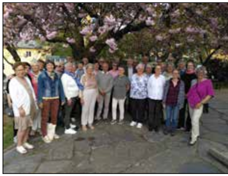
Reisefølget utenfor Birkeland

Prekestolen ble i 1676 skjenket kirken av fremtredende tyske kjøpmenn på Bryggen. Trappen er dekorert med 8 kristelige hoveddyder, oppstilt som kvinner med ulike attributter. Nederst synes prekestolen å bli båret av fem små barnefigurer. Prekestolen og himlingen over gjennomgikk restaureringer på 50-tallet og i tidsrommet 2010-15.