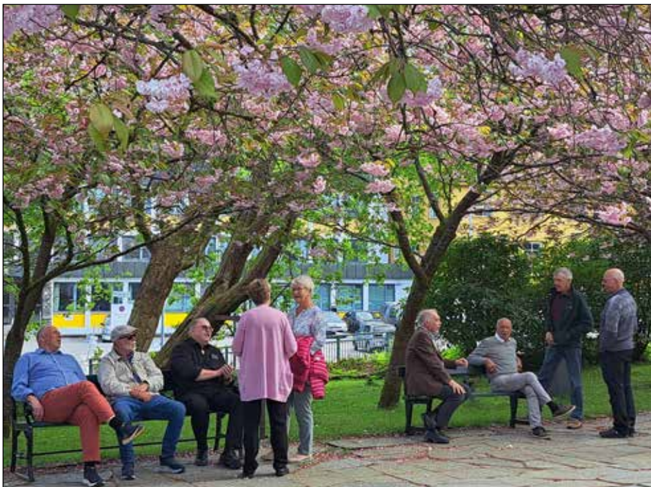
Avslapping i parken

Fra kirken gikk vi til Fløibanen hvor de fleste ble med banen opp til Fløyfjellet (Fløien), ett av de syv fjell i Bergen. Endestoppen ligger 320 m.o.h. og gir en flott utsikt over byen. Det var også de som gikk opp, muligens inspirert av geitene som beitet i bratthenget nedenfor endestasjonen på Fløibanen. Det var mulig å kjøpe seg noe å spise før nedturen, blant annet på Fløien folke-restaurant, men lang kø (og stive priser?) motiverte flere til å ta banen ned og satse på mat nede i byen. For noen ble varm Bergensk fiskesuppe ved mateltene på Fisketorget valget. Det smakte fortreffelig i et litt kjølig og småvært vær.