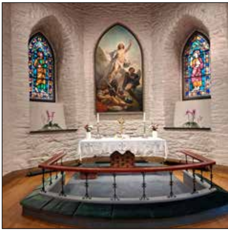
Fra Birkeland kirke

ret er fra slutten av 1400-tallet. Maria med Jesusbarnet er avbildet i et midtfelt, mens St. Olav og St. Katarina er å finne på henholdsvis hennes høyre og venstre side. Fløyene er viet apostlene med deres symboler. Når skapet er lukket, dukker malerier fra Jesu liv opp.