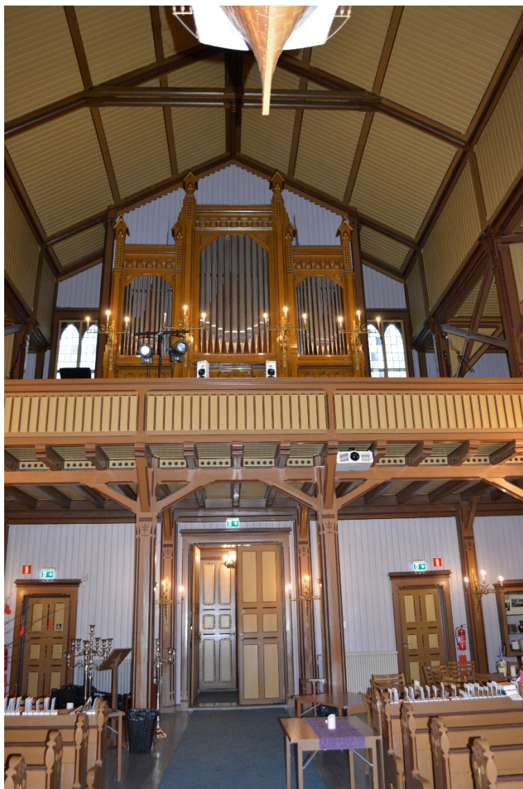
Kirkene i Grimstad, Fjære og Fevik